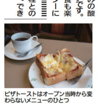
ピザトーストはオープン当時から変わらないメニューのひとつ

「この国の海を渡った北の奥には遙か遠くまで見渡せる陸地がある。合戦で命を失うより、そこに渡って住もうと思う」。頼時はそう言って一族郎党、その従者など50人ほどで、一艘の大