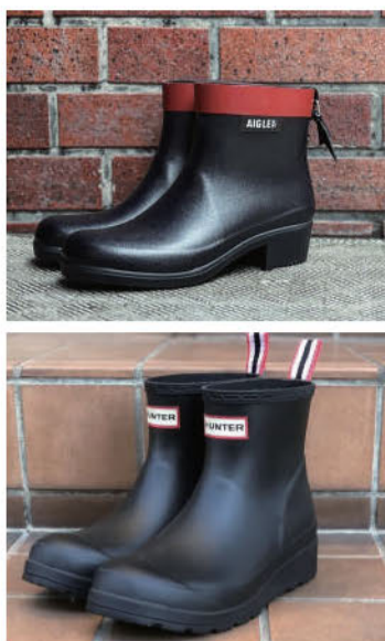
海外ブランドの靴は、海外特有の凹凸の多い道に合わせ、足への衝撃を和らげるようなつくりになっているものが多いそう

これから梅雨の季節。濡れた路面で滑ったり、足元が温っぽくなったりと外出するのがおっくうになってきます。そんな雨の日が楽しみになってほしいと、おしゃれで機能的なレインシューズをおすすめして