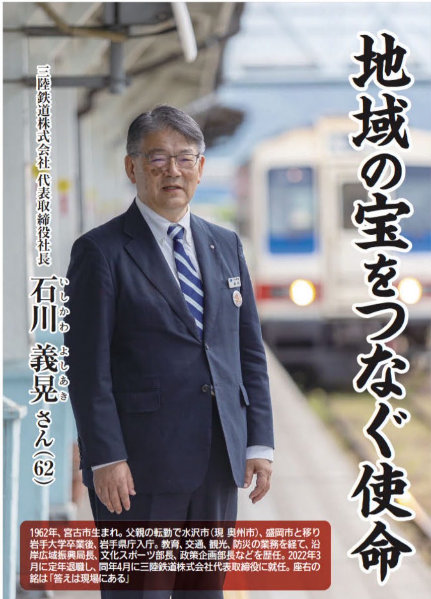
三陸鉄道株式会社代表取締役社長