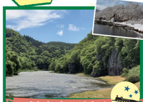
ひららき たていわ 平良木の立岩