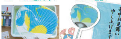
【作り方4】好きな模様ができたらフロート紙を避けよう!