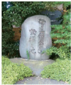
「講道館柔道発祥の地」の碑