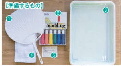
①うちわ BSS ¥137 ②マーブルング液 墨運堂 ¥1,100 ※価格はすべて税込 ③水を入れたトレー ④ふきんやティッシュペーパー ⑤②にセットで入っているフロート紙

急に気温が高い日が続く。マーブルング液を垂らし、ロート紙を一度沈めます。ようになりました。今回は夏に欠かせないアイテム「うちわ」をマーブルングで彩ってみましょう。 マーブルングとは、水に①トレーに水を入れ、フタの上にマーブルング液を