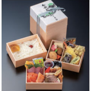
感謝の気持ちを伝えるため一品一品丁寧に、上質な旬の味を届けてくれます

創業して80年近い仕出しの老舗「美藤」。一品一品が豪華なお膳料理から、こだわりのおかずが詰め込まれたお弁当まで幅広く展開しています。「松風」「水月」「岩手山」の三段折弁当シリーズは3年で25万食以上を売り上げた実績を誇り、特に「岩手山」はファンが