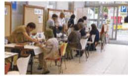
ワークショップも大にぎわい