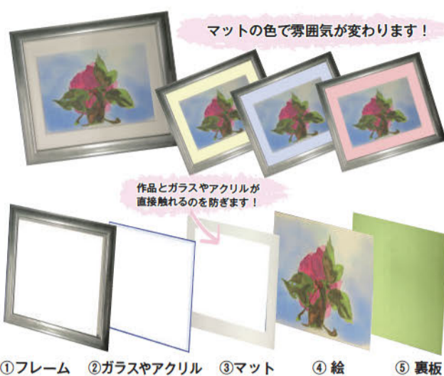
①～⑤の順に重ねると写真のような額装に仕上がります。

色鮮やかに描かれた絵や、心に残るものや風景などを撮ったお気に入りの写真。管さされていますか。ファイ 皆さんは絵や写真などのアート作品をどのように保たれていますか。ファイ