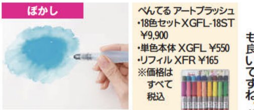
水でぼかすことができます