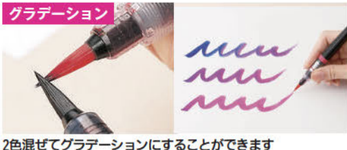
2色混ぜてグラデーションにすることができます