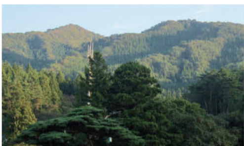
右の後線をたどって左奥の頂へと登りつめる。吉浜から見上げ、大きな「六」と読んだ