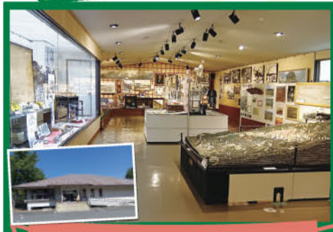
八幡平市松尾鉱山資料館