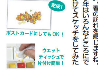
完成! ポストカードにしてもOK!