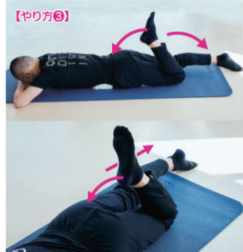
※日本コンディショニング協会のメソッドを使用しています

1つつ伏せになり、おへそ部分に丸めたタオルをあてます。ももの付け根が浮いたり、脚を動かすとおしりが左右に揺れる方はももの