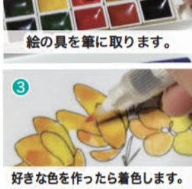
3 好きな色を作ったら着色します。