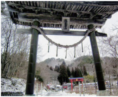
荘厳な鶴鳥神社の鳥居からながめた卯子西山。尾根続き右手に本殿(奥宮)が鎮座している