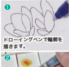
1 ドローイングペンで輪郭を描きます。