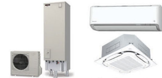
電気温水器からエコキュートに換えてこれからの季節、エアコンも省エネ性能の高いものにするのもおすすめ