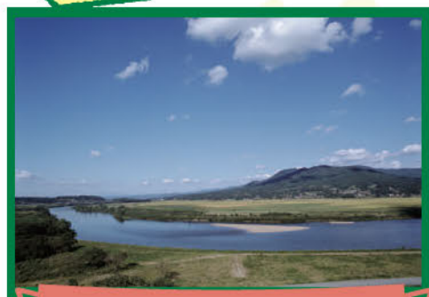
高館義経堂からの眺望