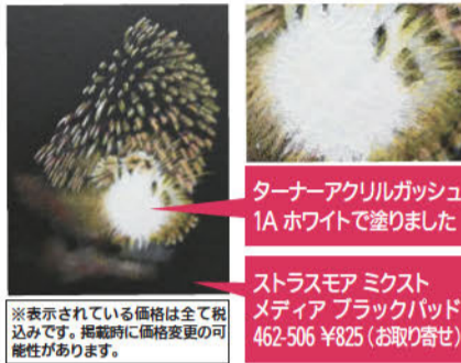
ターナーアクリルガッシュ1A ホワイトで塗りました ストラスマア ミクストメディア ブラックパッド 462-506 ¥825 (お取り寄せ)

行きや質感を表現することができ、また、早く乾くのも特徴で乾くとマットな仕上がりになります。この特性を生かして重ね塗りや盛り上げも可能で、油彩風の絵にすることもできます。