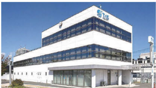
盛岡の市街地中心部にある株式会社トリスでは、迅速なSOS対応を心がけている

キユートの切り替え 工事も実施。設置から故障時のアフターフォローまで同社社員が一貫対応してくれま。お客さまへ安心感を届けられるよう「スピード・サービスサポート」の3つのSを心がけており、各部門で連携し合いながら万全なサポート体制を整えています。設備トラブルがあれば在籍する十数名のサービスマンのうち現場に近い担当者が駆けつけ、待たせないように努めていると話します。