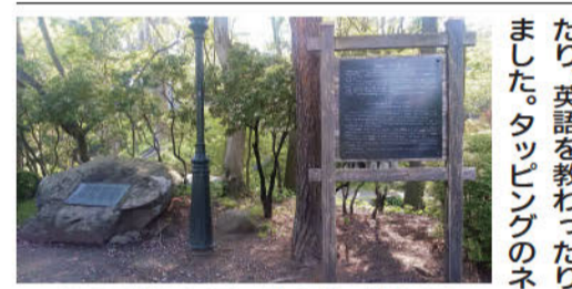
宮沢賢治「岩手公園」の詩碑(盛岡城跡公園)

盛岡城跡公園内には、宮沢賢治の文語詩「岩手公園」の詩碑が建てられています。1970(昭和45)年に建てられたもので、詩には賢治と交友があったタツピング一家の印象が記されています。