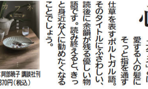
著:阿部曉子 講談社刊 1,870円(税込)

シニアズブックカフェ さわや書店 栗澤順一 心に染みる、おいしい物語 物語の後半、薫子はせつなの抱えている過去を知ってしまう。すべてを受け止めたうえで、薫子がせつなのために取った行動とは、いったい…。 「カフェ」とは、愛する人の髪にそっと指を通す仕草を表すポルトガル語。そのタイトルにふさわしい、読後に余韻が残る優しい物語です。読み終えたと、きつと身近な人に勧めたいくなることでしょう。