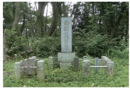
南部英磨の墓(聖寿寺)

イベントチケットプレゼントの応募方法 ▶郵便はがき、または応募フォームから郵便番号、住所、氏名、年齢、電話番号、どこでシニアズを見たか、面白かった記事と広告をご記入・ご入力の上、ご応募ください。 応募締切は10月15日(日)当日消印有効。※当選は商品の発送をもって発表にかさせていただきます。※今回は「盛岡市民マンドリンクラブ」さまのコンサートペアチケットがプレゼントとなります。 ▶宛先 〒020-0026 盛岡市開運橋通3番41号 ダビッチビル KOHOメディア案内 シニアズ編集部 読者プレゼント係まで