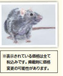
※表示されている価格は全て税込です。掲載時に価格変更の可能性があります。

【白の画用紙】 アヴァロン水彩紙 スプリング 300g 中目 AVS-SMホルペイン画材 ¥2750 【黒の画用紙】 ストラスモア ミクスト メディアブラック パッド462-506(A5大) ホルペイン画材 ¥825 黒の画用紙は取り寄せ商品になります。