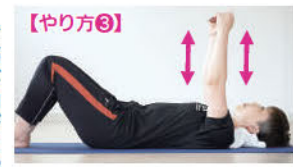
体のお悩み募集中! リクエストにお答えします!

歩くことのメリット。筋力・血管力を回復させる。歩くことのメリット。筋力・血管力を回復させる。歩くことのメリット。筋力・血管力を回復させる。