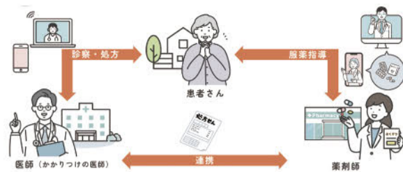
オンライン診療のイメージ

近ごろ耳にするのが増えた「オンライン診療」。言葉だけ聞くと難しく感じますが、簡単にいえば「病院に行かずに、自宅などから医師の診察を受ける方法」です。高齢化が進む中で、移動の負担を減らす手段として注目されています。