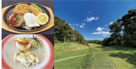
広々としたコースでプレーした後は、おいしいランチをどうぞ

61年。今回はそんな懐かし模様がデザインされた、マジックインキ、愛らしい動物の顔のケースののりなど、思い出もみがえり嬉しくなります。中でも、スーパーカー消