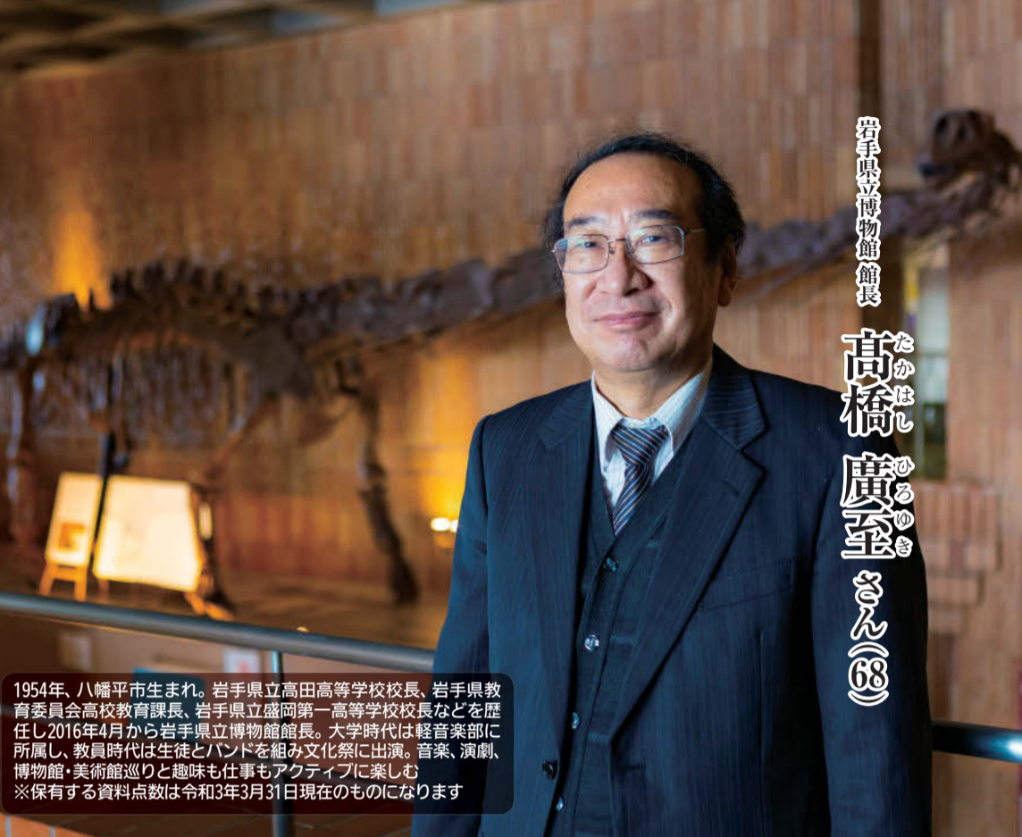
岩手県立博物館館長 高橋 廣至(68) 1954年、八幡平市生まれ。岩手県立高田高等学校校長、岩手県教育委員会高校教育課長、岩手県立盛岡第一高等学校校長などを歴任し2016年4月から岩手県立博物館館長。大学時代は軽音楽部に所属し、教員時代は生徒とバンドを組み文化祭に出演。音楽、演劇、博物館・美術館巡りと趣味も仕事もアクティブに楽しむ ※保有する資料点数は令和3年3月31日現在のものになります