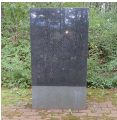
愛宕山にある「アダシオ」の詩碑