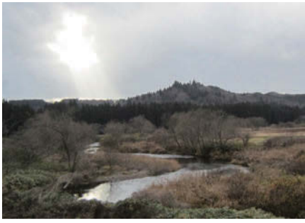
かぐや姫が舞いもどったように優美な衣川月山と衣川。中腹からは、東福山や中尊寺開山を遠望できる

岩手県内に月山という名山は五山ある。宮古市重山「すそ野を巻く水面は茂半島の月山(御殿山)」、八幡平市安代の御月山、北上市和賀三山の月山、奥州市江刺の月山、そして奥州市衣川の「衣川月山」である。