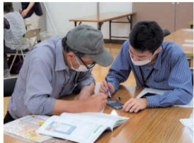
クラウドサービスを利用すればスマホ内がデータでいっぱいになるという不安も軽減できる

岩手県内に月山という名山は五山ある。宮古市重山「すそ野を巻く水面は茂半島の月山(御殿山)」、八幡平市安代の御月山、北上市和賀三山の月山、奥州市江刺の月山、そして奥州市衣川の「衣川月山」である。