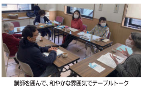
講師を囲んで、和やかな雰囲気です。