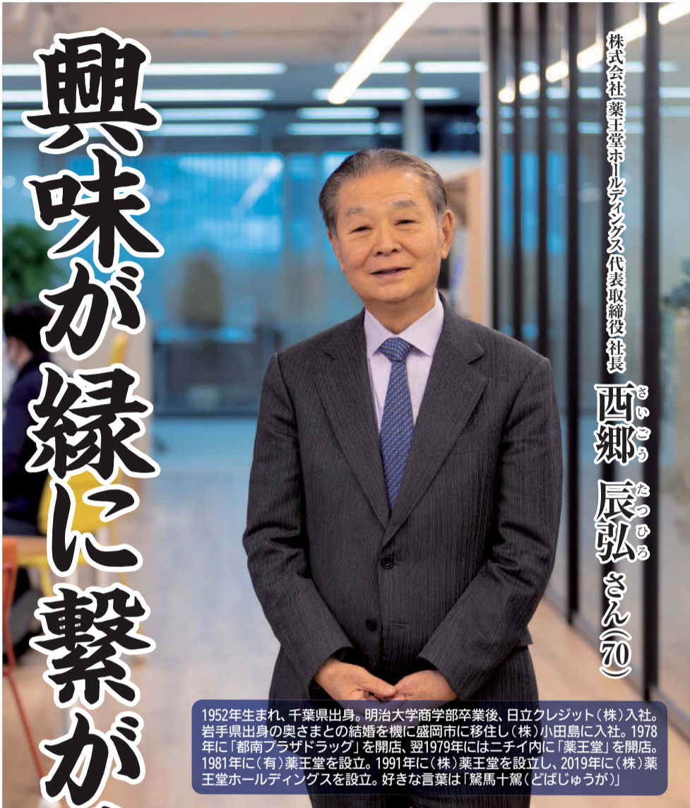
株式会社薬王堂ホールディングス代表取締役社長