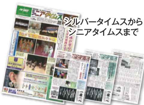
シルバータイムスからシニアタイムスまで

盛岡タイムス 検索 講読料:月決め2,262円 1部 売り100円(税込)(本体価格 2,095円、消費税 167円)