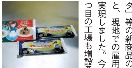
星形の断面でもっちり伸びにくい「星影の Pasta」、九戸甘茶で仕上げた細麺と気仙椿油ソースの「樺マーメイドパスタ」

暮石五人衆の物語【第1作】 この物語は46億年前に地球が出来た頃、宇宙どこからか金色の隕石が落ちて、それが五つに分けて分かれ地表に転がりました。やがて海が出来、数十億年の間に強固な石も波に洗われて平たい玉石になりました。その玉石が現代の地図で三陸海岸に打ち上げられていた。そこに来た五人の若者が金色に光る石を見つけた。その若者達が急激に覚醒し、容姿も目つきも変わりまるで神がかった姿に変貌しました。ほどなくしてその五人が船に乗り、現在の関東方面に行く途中に台風で遭難し流された船は現在の中国にたどり着きました。そこで彼らは生きる為に新たな文化、自分達が覚醒した石に似た黒と白の石を使い「囲碁」を発案しました。それは帝王学の一つとして広く中国各地に伝わり入り、その考え方があって、多くの賢者の排出を行って中国の発展に寄与する事になりました。その五人は各地で名譽を授けられ、大々しく日本に帰りました。その後代々武家や商家の影・表となって大々しく日本の世界を飛び回る最高峰のビジネスマン生活をしていましたが、2011年3月11日、東日本大震災が起きた。その時、五人の継承者が持つ金色の碁石が光り輝き、彼らは氣を失い、そこに現れた初代先祖が言う教えをもとに、石を手に入れた地、三陸岩手・碁石海岸に向かい、そこで数々の功績を挙げて復興させると言う物語です。碁石五人衆の物語です。全12作でお届けいたします。 作家:花尾穂実田 / 提供:盛岡中ノ橋「碁の森Mini」