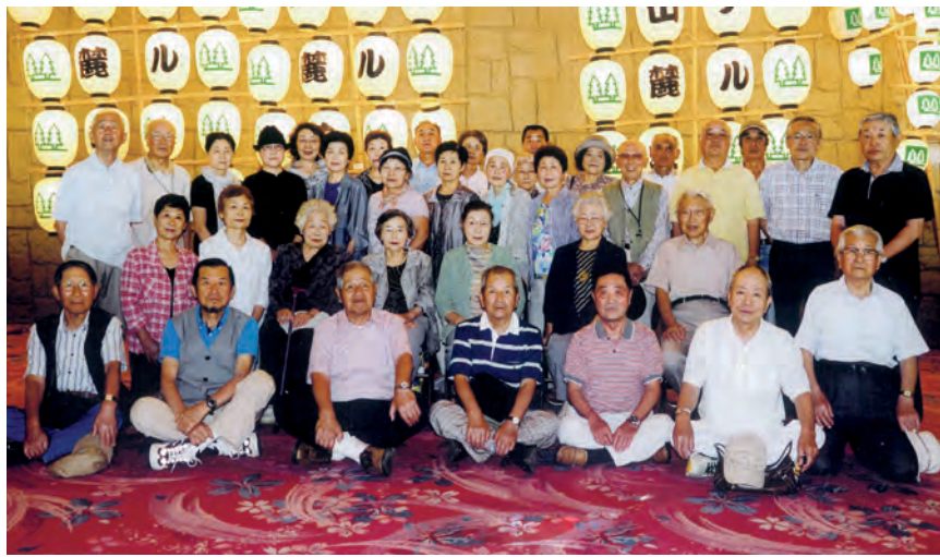
昨年、田沢湖高原温泉プラザホテル山麓荘での親睦会