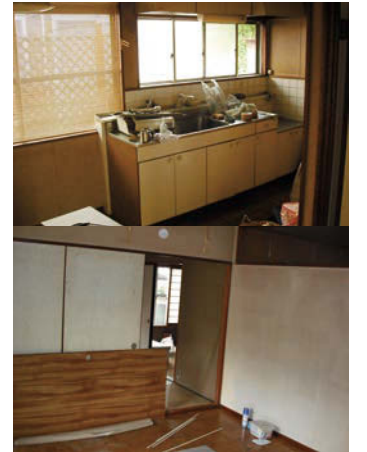
《施行前》 盛岡市黒石野 A様邸

リフォーム工事で大切なことは、歩くのに負担にならない動線を意識して施工することです。 身体の不自由な方がスムーズに移動できる間取り、台所で奥様が歩きやすいシステムキッチンや食卓では、各メーカーの優れた点をきちんと伝え施主の要望をしっかりと把握して、各メーカーと折衝後、再び施主に提案し、シヨールームなどへ案内します。リフォーム工事で大切なことは、歩くのに負担にならない動線を意識して施工することです。