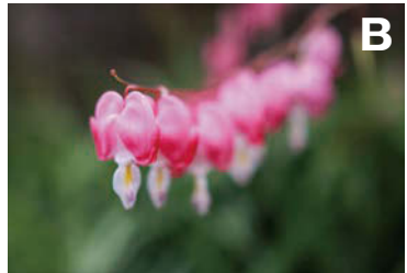
空気感や雰囲気伝わる印象に