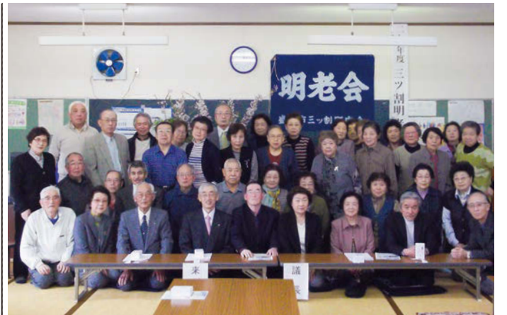
三ツ割住民センターで行われた今年度の総会

みになっていきます。 元気でいるために声を出 し、身体を動かす、笑い合 うことが大切だと月に一度 の定例会では合唱とラジオ 体操を必ず行っています。