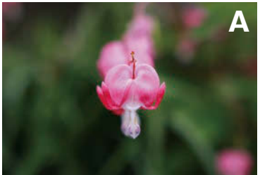
悪くないけど、あまりパツとしない印象