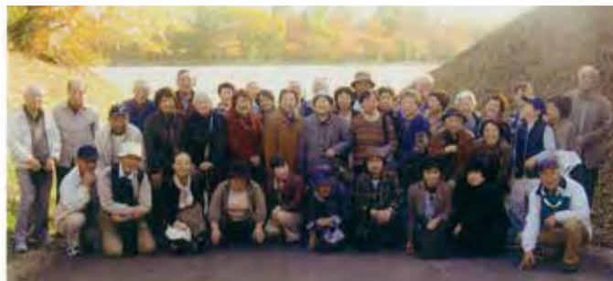
八幡平への温泉日帰り旅行

野住宅の緑寿会。特に力をいれたい。地域の絆を深めるため、奉仕活動です。毎月2、3回行う資源ゴミの分別をはじめ、秋には落葉