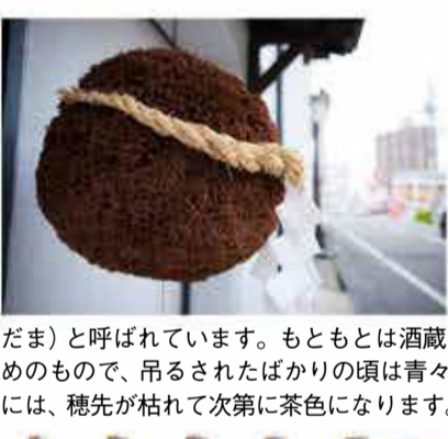
酒蔵や酒屋の前に吊るされている円い玉は、杉の葉の穂先を束ね、ボール状にしたもので、酒林(さかばやし)とか杉玉(すぎだま)と呼ばれています。もともとは酒蔵が新酒のできたことを知らせるためのもので、吊るされたばかりの頃は青々していますが、酒の熟成が進む頃には、穂先が枯れて次第に茶色になります。