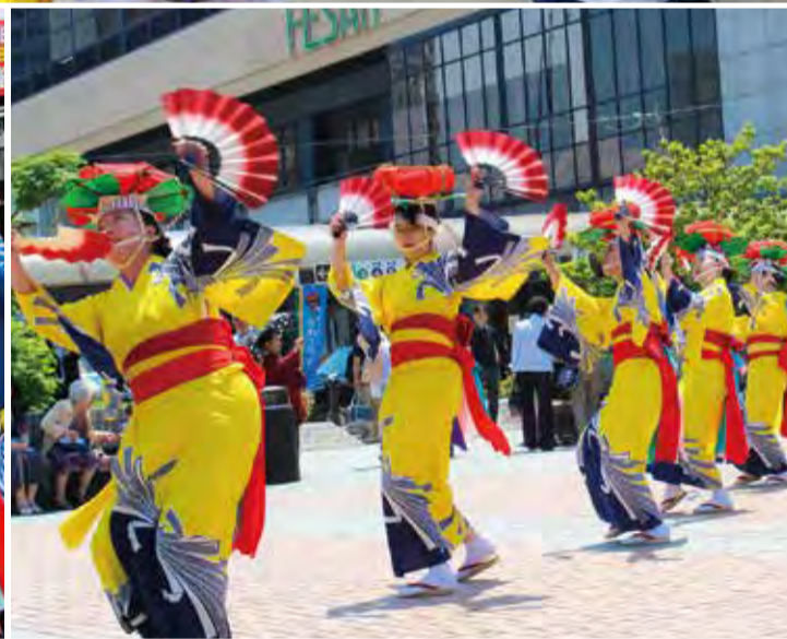
いずれも資料写真です。