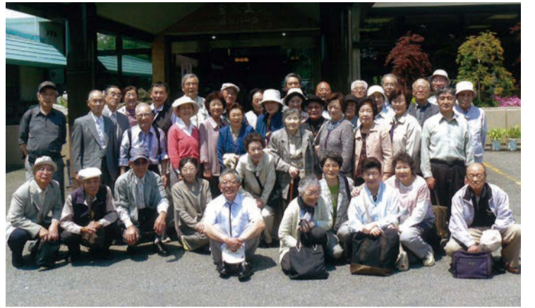
平成25年花巻金矢温泉での研修旅行

ルは、詩吟・囲碁将棋・踊り・園芸・麻雀・カラオケ等、多種多様。会員一人一人の「これをしてみたい」という思いを大切にできた結果、23ものサークルができ、それぞれが活発に活動中。 環境美化や健康増進、文化講演会、研修旅行等、会員の活動も活発。世代間交流には特に力を入れ、未来を見据えた地域コミュニティを育てています。 そのさまざまな活動から、老人福祉増進への功績が認められ、平成24年10月に厚生労働大臣賞を受賞しました。「平均寿命から健康寿命へ」を合言葉に、これからも一人一人が主役となって歩んでいきます。