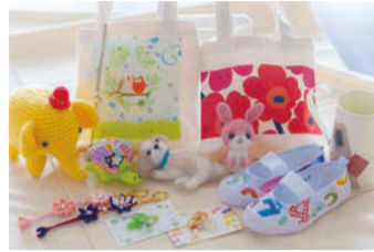
ひまわりフリースペース 年中無休(お盆等除く) 10時~15時 入場料500円 材料・ミシンレンタル代等別途

ワンコイン十材料費で、気軽にハンドメイドが楽しめる、ひまわり大通店3階のフリースペース。今回は、今一番人気の「デコポッジ」にチャレンジしました。デコポッジとは、カラフルなペーパーナプキンを様々なものに張り付けデコレーションする手芸品のことです。専用のボンドでペーパーを貼り乾かすだけで、まるでプリントしたような仕上がりになる手軽さも魅力。布製品をはじめ、ガラスやプラ スチック、石鹸などにも貼れるので素材を選ぶ楽しさもあります。その他にも、キュートなキーホルダーやペンダントになる「レジジン」や、「クラフトバッグ」「パッチワーク小物」など、最近では新しいハンドメイド素材がどんどん増えているので、アイデア次第で作品の幅は無限大です。 きつと想像以上に、愛着の湧く作品になりますよ。