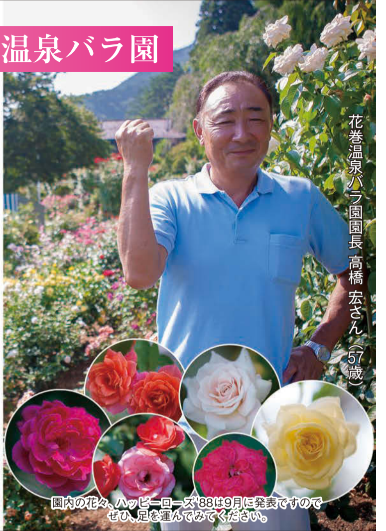
園内の花々、ハッピーローズ'88は9月に発表ですのでぜひ、足を運んでみてください。

開園時間：6時～19時 ※季節によって変動します。 住所：岩手県花巻市湯本第1地割125 電話：0198-37-2111