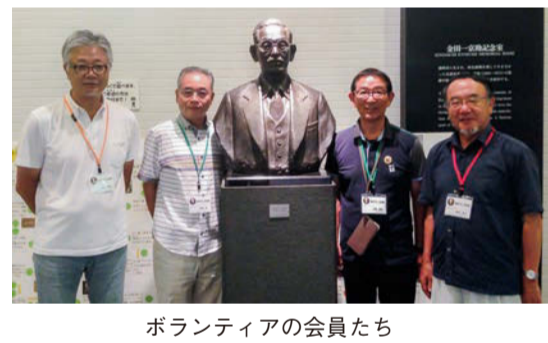
ボランティアの会員たち

他の会員も、やりがいを持って自主的に活動しているそう、会員同士で集まれば情報交換をするなど、今でも勉強熱心な方が多いという。同会には30代の若い会員もおり、今後彼らが10年・20年と歴史のバトンを後生に繋いでいくことだろう。