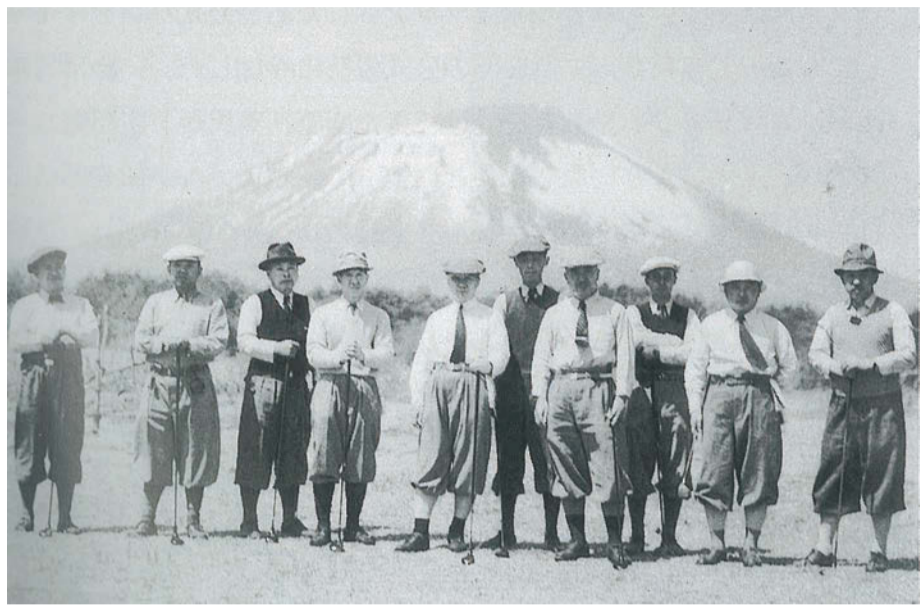
ニッカーボッカーにネクタイ姿で(岩手山をバックに浜民にて)昭和12年当時

昭和12年、岩手県で最初のゴルフ場が浜民村(現在の盛岡市玉山区浜民)に誕生。2・26事件の翌年、日中事変が起きた年のこと。東北では、宮城県塩釜市の仙塩GCについて2番目です。まさに、激動の昭和の真つ口中、岩手ゴルフ倶楽部生田野コースとしてはじまりました。歴史ある岩手GCは南部家との関わりも深く、44代南部利