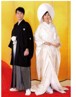
憧れの和装をフォトウェディングで叶える。前撮りにも人気

「結婚式はドレスだけだったけれど、和装の写真も残してあげたい」というときには、「和装フォトプラン」もおすすです。