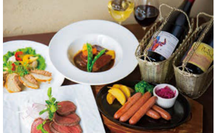
熟成により味わい深くなった短角牛が、とろけるような柔らかさで味わえるプラン