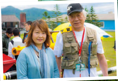
「ロケットに関わるときの主人は、少年のような目をしてますから」と奥様