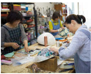
工房には沢山の人が集う