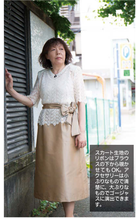
スカート生地はリボンが下から覗かせてもOK。小さくセサリは小ぶりなもので清楚に、大ぶりなものでゴージャスに演出できます。

80年代に流行した大きめサイズから、ピッタリサイズに流行が変化しました。ですが体型を気にしてなかなか自分の体にピッタリのサイズは...と敬遠してしまいませんか。そこで提案したいのが、あくまでも着やすいナチュラルシヨルダーでありながら、脇をゆるやかに仕上げた、トップは3〜4cmくらい長さを残してカットするのがポイント。ワックスで毛先に動きをつけてあげれば、スウェットでもできる少しいだけ遊びを取り入れたヘアスタイルの完成です。襟足がすっきりしているのが、真面目な夏に出かけてみませんか。