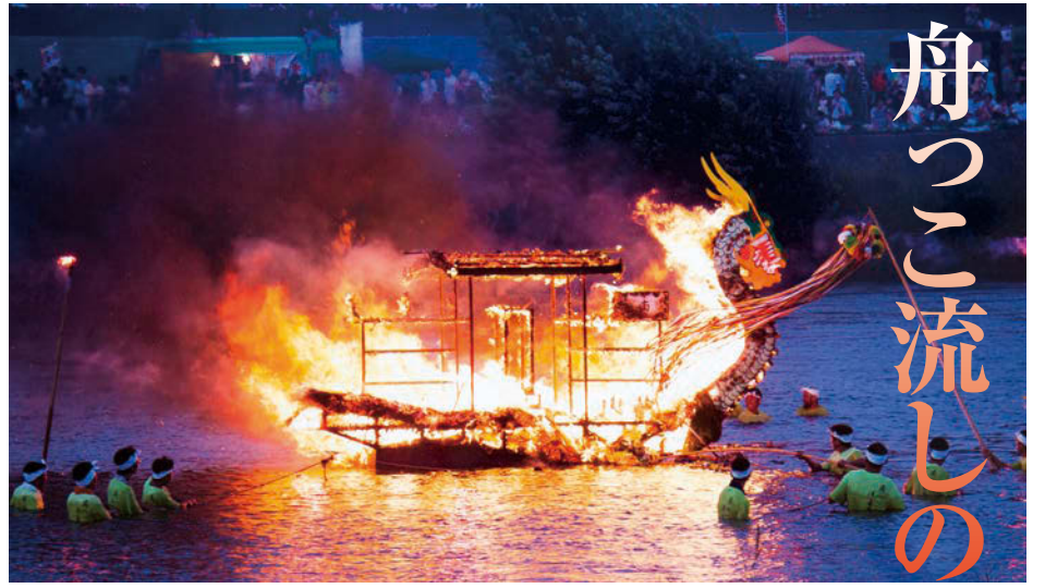
今年は市内13団体から「舟っこ」が参加