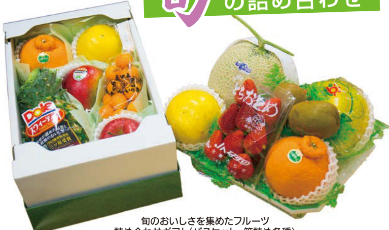
旬のおいしさを集めたフルーツ詰め合わせギフト(バスケット、箱詰め各種)

では、専門店ならではの贈答用仕立てで、一級品の季節の果物をセレクトし、彩りも鮮やかに美しく詰め合わせてください。 どんな果物を選べばいいのか迷った時でも、用途や予算、希望に合わせて、スタッフが親身になって果物を選選してコーディネートしてくるので安心して仕入れ状況にもよるので、お買い求めの際は、事前に電話または予約がおすすめです。