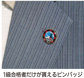
1級合格者だけが貰えるピンバッジ

昭和35年生まれ。東京都出身。サレジオ高等学校卒業。中央大学卒業後、盛岡へ。趣味は読書、映画鑑賞。