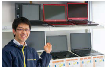
当店では中古も取り揃えていますので、お気軽にお立ち寄りください

今年4月にウィンドウズビスタのサポート期限が終了します。それに伴うパソコンの買い替えや、新年度を迎えるにあたり新たにパソコンの購入を考えている方もいるのでは無いでしょうか。そこで今回は、パソコン購入時のポイントを紹介いたします。 ①パソコンの種類 パソコンは大きく分けて「ノート型」と「デスクトップ型」の2種類があります。 ②パソコンの性能 パソコンは内部部品の種類によって性能や金額が大きく変わりますが、「何をしたいのか」が一番のポイント。インターネット・メール・文書作成等、一般的な使い方をされるのか、画像や動画編集・オンラインゲーム等、パソコンに負担がかかるような使い方をされるのか、目的に見合ったものを選ぶとよいと思います。 ③パソコンの性能 パソコンは内部部品の種類によって性能や金額が大きく変わりますが、「何をしたいのか」が一番のポイント。インターネット・メール・文書作成等、一般的な使い方をされるのか、画像や動画編集・オンラインゲーム等、パソコンに負担がかかるような使い方をされるのか、目的に見合ったものを選ぶとよいと思います。 国内製、海外製がありま