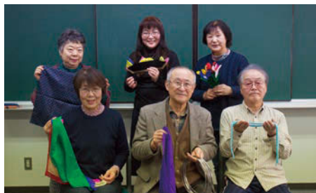
「こうやって集まって皆とワイワイ話しをするのも楽しいですね」と、いきいきとした表情の皆さん

きつかけで、その時の受講者が中心となり発足しました。現在、メンバーは50代、80代、男女およそ20人が所属。和気あいあいとした雰囲気の中、指導者の支援により勉強と研鑽を重ねています。