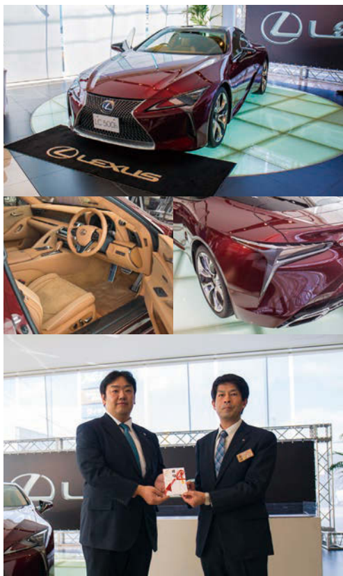
寄付金を「いわての学び希望基金」に手渡す元持社長(左)

「子どもがネットゲームでアイテム購入したいというので一度だけの約束で番号を入力してクレジット決済した。ところがその後子どもが勝手にアイテムを順次購入してしまった。何