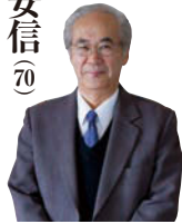
菊池安信 菊池安信 菊池安信

仏事・葬儀を納得できる内容や価格で行いたい場合、事前相談をして「もしも」に備えておくことがおすすめです。と、はいえ、A社に相談にいけないA社のプランを、B社に行けばB社のプランを説明・勧誘されるのが通常。「できれば公正・中立の立場でアドバイスを受けたい」とそんなとき頼りになるのが、無料相談窓口「エンディング・プラン盛岡」です。 「予算的に厳しいので仏事や葬儀の費用はできるだけ抑えたい」といった生活レベルの人が多い世の中。昔であれば、周りにいる人 「花間」の酒、／独り酌んで相親しむもの無し。／杯を挙げて明月を邀え、／影に對して三人と成る。／月 既に飲を解せず、／影 徒らに我が身に隨う。／暫く月と影を伴い、行楽 須らく春に及ぶべし。／我れ歌えば 月徘徊し、／我れ舞えば 影零乱す。／醒むる時は同に交歓し、／酔つて後は各々分散す。／永く無情の遊を結び、／相期す 遠なる雲漢に。 （大意） 咲き匂う花かげに酒德利を持ち出したが、つき合ってくれる友もいない 「事前相談の悩みを解決！もしもに備えて事前相談②」 「仏事・葬儀の悩みを解決！もしもに備えて事前相談②」 「仏事・葬儀の悩みを解決！もしもに備えて事前相談②」