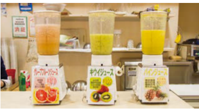
買い物がてらイトインコーナーで美味しいジュースを一杯!