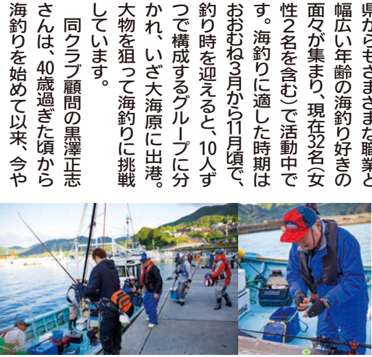
それぞれに、ロッド(竿)やリール、仕掛けなど使い心地や細部にまでこだわった道具を持ち寄り、出かける準備も万全に

今年40周年を迎えた「盛岡中央フィッシングクラブ」は、盛岡市内でも古い歴史があるクラブで、盛岡市を中心に紫波、滝沢、ほか隣県からもさまざまな職業と幅広い年齢の海釣り好きの面々が集まり、現在32名(女性2名を含む)で活動中です。海釣りに適した時期はおおむね3月から11月頃で、釣りを迎えると、10人ずつで構成するグループに分かれ、いざ大海原に出港。大物を狙って海釣りに挑戦しています。