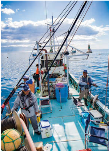
「今日はどんな魚が釣れるかな」「何匹くらいかかるといいかな」「ワクワクしながら海原へ」