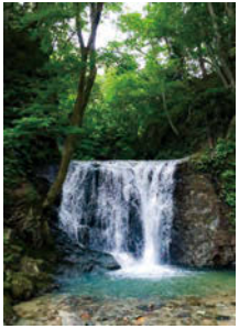
神棲む森の中から生まれる流れが滝となって激しくほとばしる。

この山塊は「雨を司る神」 竜神」が棲まう聖域なのだ。 今も昔も自然の猛威の 前に人間はなす術もない。 毎日の天候も同様である。 民たちにとって安定した生 活に最も必要だったのは雨 や日光という天の恵み。パ ランスよく与えてもらえ 天候こそが豊かな農作物を 育み、ひいてはそれが領内 の安寧、人々の幸福につな がる。宮沢賢治は「雨ニモ マケズ」で「日照りの時は 涙を流し、寒さの夏はおろ おろ歩き」と書いた。冷夏 や日照不足ばかりが凶作や 飢饉を生むわけではなく、 日照りもまた同様に飢饉の 要因になる。その日照りを