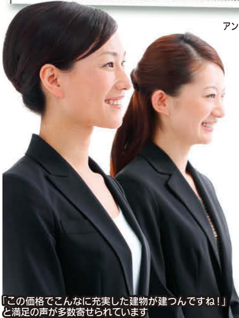
「この価格でこんなに充実した建物が見つねえ!!」と満足の声が多数寄せられています

アンケートの8割の方が5段階評価の4~5の評価をつけているとのこと。満足度の高さが伺えます