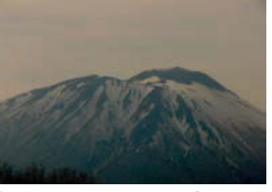
「白鳥座」で最も明るい恒星デネブに当たる岩手山

例えは盛岡エリアには「白鳥座」が姿を現す。白鳥の頭が「岩手山」、両翼が「駒ヶ岳」と「姫神山」、尾羽が「岩手山」「愛宕山」「蝶ヶ森」、そして「鬼越山」「篠木峠」「沼森」が胴体だ。また「南昌山」や「毒ヶ森」「東根山」から花巻方面の低山を結ぶ