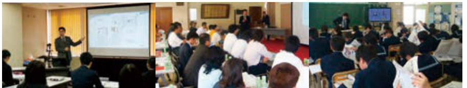
左(盛岡信用金庫の内定者研修)中央(企業セミナー)右(中学校の授業)の風景。記事を読むコツを図式で解説し、フェイクニュースの話題など最新情報も組み込んで、気軽に学べるテキストに。セミナーの後は「もっと新聞を読みます」という声が多い

宮城県気仙沼市出身。製薬会社勤務を経て、平成9年に岩手に移住。「(株)岩手日報都南センター」代表取締役社長に就任。学生時代は器械体操、柔道などスポーツに親しみ、水泳は今も継続。趣味はネット麻雀と読書、多彩な顔を持っています