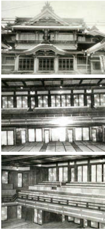
当時の衆楽座の様子。昭和12~17年までは衆楽座で使用、以降昭和56年までは国劇として長年親しまれたそうです。場所は紺屋町・菊の司酒造会社向いの現ライオンズマンション紺屋町

それは暫く擱くとして、裏方のことでした。 私の父は昭和初期から舞台芸能の裏方のチーフに当たる大道員師(舞台装置家)でしたので、当時の仕事の一例として、父から聞いた話で神社の鳥井のセツこまでくると、これをお読みになっている方は、そ