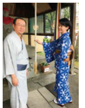
浴衣を楽しむシニア

「この年まで、浴衣を着たことがなかった。この夏は浴衣を着て、街歩きしたりカフェをしよう」と初挑戦する様子。ぜひ、浴衣でシニアならではのライフを。」