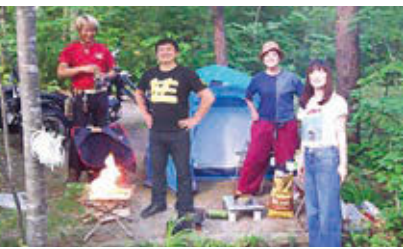
無理せず道具を揃えましょうと笑う店長

今回は自然の厳しさの中で自分を鍛えるため、私が若い頃ナタとライターと少のお米だけを持って実行したバカな『山籠り』のお話です。 自然に挑む為に最小限の装備で出かけたので、ご飯は30分程米を水に浸し野草に包んで中に埋めその上で火を焚く方法で作りました。釜が火の下にあってもいいんじゃないかって発想でこれなら鍋は要りません。 焚火で魚を焼いているうちに2時間程で炊き上がりますポイントが60分で一度火