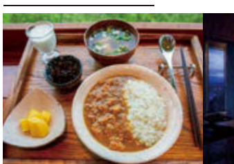
(左)優しい味わいの「カレー葉の葉粥セット」(850円)(右)世界にも誇れる「岩山」の魅力はこの場所から発信中

座はこれこそ一目瞭然、東北一の豪華絢爛な劇場として東北の名所となりました。 以上、東北一目の肥えた芸処の所以の一端でした。