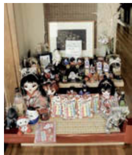
盛岡市内にも有名な座敷童のお宿がある。泊まって感じたままをレポートしてみたい

もうすぐ梅雨が明け、真夏がやって来る。夏といえれば怪談。ということでは「納涼特別企画」と位置づけ、私(筆者)が感じた「何か尋常ではない物音」の怪異譚をいくつか紹介させていた