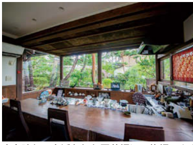
古き味わいを活かした天井板に一枚板のカウンターの贅沢な空間

今回をこ紹介するのは、鉈屋町にひっそり佇む隠れ家カフェ「時環」。昔、浴室だった場所をリノベーションしたというごんまりとしたスペースには、珈琲を提供する厨房とカウンター5席、席に座ると大きな窓から料亭の名残を感じる庭園の風情を贅沢に眺めることができます。