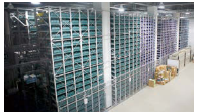
蔵書をストックしているバックヤードは巨大な空間。見学も受け付けている