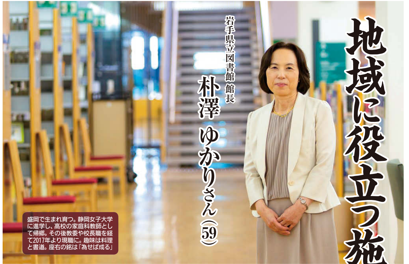
盛岡で生まれ育つ。静岡女子大学に進学し、高校の家庭科教師として帰郷。その後教委や校長職を経て2017年より現職に。趣味は料理と書道。座右の銘は「為せば成る」