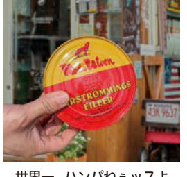
世界一、ハンパねえッよ

「フシューッ」その缶詰を開けた瞬間そこにいた全員が呼吸を止めその場から爆走しました。その日は世界一臭いとされるニシンの塩漬け「シールストレミング」の試食会をしたのですが、想像のはるか上を行く臭さはドリアンが可愛く感じられる、納豆の18倍、クサヤの6.7倍、鼻じゃなくて脳が直接臭いと叫び声を上げました。バラエティー番組で見る芸人さんのリアクションは本物ですね。じつはこれ生ニシンを缶詰に詰め発酵させた北ス ウエーデンの伝統食で、爆発の危険もあり空輸禁止なので日本には船でしか入ってこない貴重品なんです。到着する頃には肝心のニシンの半分はガス化して缶がパンパンに膨らんで丸くなってるので結構じりじりです。『食は生き物共通最大の欲』ですが、人が他の動物と違う点は『生きるための食事』と『楽しむための食事』の2つがある事です。私は特にアレルギーも好き嫌いもないので世界中を旅してフニ蛇・虫・トナカイなど色んなモノを食べ歩いてき