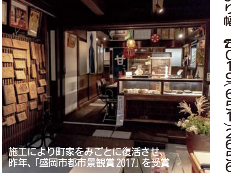
施工により町家のみごとくに復活させ、昨年、「盛岡市都市景観賞2017」を受賞

※会場へお越しの際は、公共交通機関をご利用ください。 ＜地域ケア係＞ ■元気はなまる筋力アップ教室 内容：簡単筋力アップ体操と健康講座 参加費：無料 対象：概ね65歳以上の盛岡市民(申し込み不要)