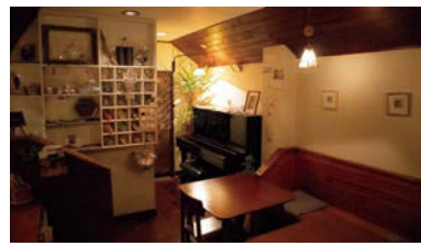
店内にはピアノが置かれ、いずれは定期的に演奏会も行っていきたいとのこと

中津川の上の橋近く、ナチュラルな緑色の外観に、「きつき音」と書かれた小さな看板を掲げる喫茶店があります。店内にはカウンターとテーブル席が合わせ、10席。こぢんまりとしていて、ちよつといい心地よさを感じるほつりした空間です。カウンターには本棚が据えられており、エッセイや文庫本などが陳列。店の一角には支援学校などのハンドメイド作品を展示販売するコーナー、奥にはピアノが置かれ、いずれは定期的に演奏会も行っていきたいとのこと