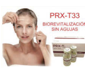
うるツツ肌を実感できるコラーゲンピール

また、ハリだけでなく顔のたるみが気になる方には、超音波ハイフレーザーの中でも進化した最先端のユーティムスがお勧めです。顔痩せには、B N L S 顔専用脂肪溶解注射も人気です。お悩みに応じて、色々なご提案ができますので、まかいお悩みでも、一度お気軽にご相談ください。