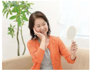
疲れた肌は回復も大変

季節はすっかりと秋ですが、今年の夏は特に日差しが強く暑かった事もあり、疲れたお肌のハリを取り戻したいと思われている方も多いかと思います。そのお悩みに、お勧めなのは、コラーゲンピールと