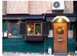
まるでおとぎ話に出てくるようなかわいらしい店の外観