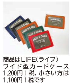
商品はLIFE(ライフ)ワイド型カードケース 1,200円+税、小さい方は1,100円+税です

いる方にとってもお得な定期券のようなものです。まちなか・おでかけバスが発売になると実はある相談が増えます。バスを入れるのにちょうど良い大きさのカードケースがなかなか見つからない……といった相談内容です。まちなか・おでかけバスは、顔写真も含めたサイズになっており、通常の定期券などよりもひとまわり大きいサイズで作られているようです。そんな時に、おすすめしているのは、ワイドサイズのカードも楽々入るパスケース。こちらは縦幅が他メーカーのものよりも1.5cmから2cm程大きく作られていますので、パスの下に