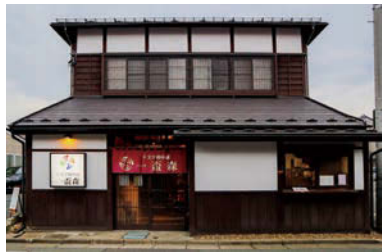
落ち着きある風格の昔の建物を活かしながら、基礎・断熱・耐震は改修により万全

元建物は70年ほど経ったもので、軽トラに魚を積んで行商をしていたという先代が建てた町家です。「昔、うちは岩手川酒蔵と隣接していましたが、道が変わり角面に。俺が氷屋をやるためにも直さなきゃと思っていたところ