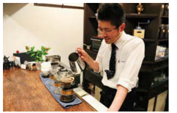
昭和の喫茶店を感じさせる店で提供するの、最新・最善の「味」を目指す

仕出し 美藤 屋号に描くのは岩手富士。岩手山を眺める富士見町に店を構えて創業80年