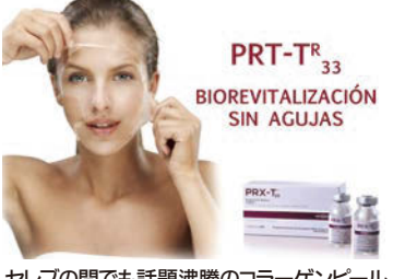
セラブの間でも話題沸騰のカラーゲンピール