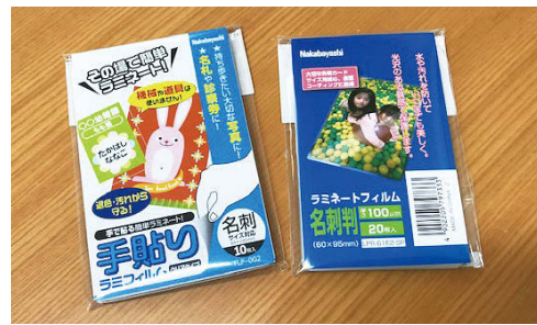
薄くかさばらないラミネートフィルム

先月にさかのぼります。7月1日、盛岡市の広報に国民健康保険の保険証の発送日について載っていました。盛岡市は7月23日(火)に発送されたようですが、みなさんは手元に届いたあと、いつも何に入れてどのような状態で使っていますか。届いた時と同じ状態のまま、保険証を使っていますか。保険証は大切なもので、購入できる。もう一つのラミネートフィルムを使う方法も、財布などにに入れても厚みが出ず、かさばらないのでオススメ。健康保険証サイズのフィルムであれば、1パックに20枚程度入って120円くらいで販売されています。(メーカーによっても異なります。盛岡市着町8-18(着町アーケード南側) 019(052)288801