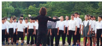
浄土への思いを込めて歌う児童の声に皆さんは静かに聴き入りながら、世界平和に思いを馳せていました

「慰霊」を世界に発信するためのものです。中尊寺、毛越寺をはじめ、町内各寺院の僧侶の皆さんによる法要