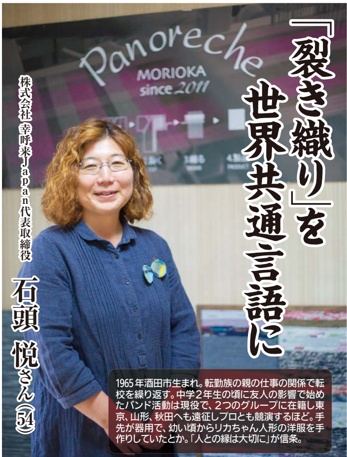
株式会社 幸呼来 Japan 代表取締役

毎月ご自宅へ郵送します 料金は、切手代12ヶ月分と手数料で合計 2,304円 (1年分)です。 ご希望の方は振込用紙をお送りしますので下記宛にお申し込みください。 TEL019(623)2788 〒020-0024 盛岡市菜園2丁目1-9 メール:info@seniorsnet.jp