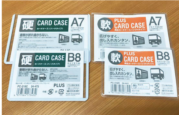
透明ケースはハードタイプとソフトタイプが選べて便利

先月にさかのぼります。7月1日、盛岡市の広報に国民健康保険の保険証の発送日について載っていました。盛岡市は7月23日(火)に発送されたようですが、みなさんは手元に届いたあと、いつも何に入れてどのような状態で使っていますか。届いた時と同じ状態のまま、保険証を使っていますか。保険証は大切なもので、購入できる。もう一つのラミネートフィルムを使う方法も、財布などにに入れても厚みが出ず、かさばらないのでオススメ。健康保険証サイズのフィルムであれば、1パックに20枚程度入って120円くらいで販売されています。(メーカーによっても異なります。盛岡市着町8-18(着町アーケード南側) 019(052)288801