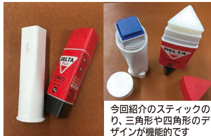
今回紹介のスティックのり、三角形や四角形のデザインが機能的です

たります際、のりやボンドを使う機会が大人よりも多いと思います。実は筆記用具だけではなく、のりやボンドも日々進化しているアイテムの一つです。液体状ののりやスティックののりも、夜になると秋の虫の音が聞こえ、季節の移り変わりが感じられます。