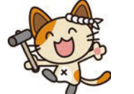
イメージキャラクター サン太郎

交通事故よりも多いヒートショックとは、急激な温度差によって血管が乱高下し、心臓や血管の疾患が起ることをヒートショックと呼びます。 ヒートショックが発端となり、死亡に至ってしまう方の数は、交通事故よりも圧倒的に多く、特に寒さの厳しい12〜1月を中心に事故が多発しています。ヒートショックが起りやすい