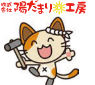
イメージキャラクター サン太郎

ご相談などの来店で「シニアズを見た」でいいモノプレゼント! お気軽にお問い合わせください 陽だまり工房 ☎0120(911)561