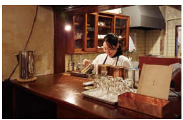
六分儀の頃の雰囲気そのままに、ゆっくりじっくり時間の流れを感じられる場所

高洞山は通年型の山である。岩手山、雲石スキー場の高倉山、南登山塊の眩いこと。時には空飛ぶ又三郎