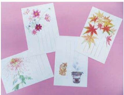
季節のはがき 大直 ¥120+税 絵柄は載せたもの以外にも何種類かございます

くさんあって、携帯電話、メールやLINEなど、時間を確保しなくても連絡を取り合える状況になりました。便利な時代だからこそ「書くモノ」を使う機会が減っています。大切にされています。手書きの手紙をもう一つと嬉しいものです。手書きの良さを改めて感じながら、相手に合わせたはがきやカード、便箋を選び、相手のことを思いながら「書くコト」を楽しんでほしいです。 立秋(8月7日)を迎えた後は、暑中お見舞いから残暑お見舞いへ変わります。今秋(8月7日)を迎えた後は、暑中お見舞いから残暑お見舞いへ変わります。