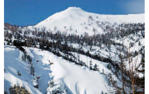
雪の茶臼岳で暑気払いしよう。まるで練乳シロップをかけた「かき氷」のように見える

馬蹄状に連なる1400m以上の十数座を俯瞰する「絶景の展望テラス」なのだ。眼下に広がる緑の大地は、自然のスペクタクルである。熊沼や夜沼のほとりにはクマ家族が棲めそうだし、上空で獲物を狙う猛禽類の高度感覚も味わえる。覗くと、ヘビや蛙・リス・兎など、緑の原で線