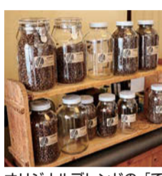
オリジナルブレンドの「てとて」「えんじゅ」がおすすめ。他にも各国の珈琲を飲むことができます。奥様手作りのスイーツも好評

び込みます。そこで二年の修行を重ね、個展を開けるほどの技術を習得。その後、盛岡に戻り、独立するために自分で窯を作ったとか。そんな一人が2008年にお店をオープン。作ったお店はもろろん手作り。改装には1カ月かけたというそのお店は木の温かみのあるアットホームなお店です。 お店のこだわりを伸也さんに聞いてみると「各国の豆を揃えているのもその一つで、いつも同じ味を作るのではなく、ハンドドリップでお客さんによって味を変えたりもしています。『今日の味はこうだね』なんて話すのも楽しいですね。他にも、妻が焼いた器で珈琲をお出ししているのも特徴ですね。ここ最近はお豆で買っていく方が多いの