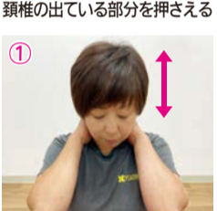
① 手を当て、上下に小さく首を動かす