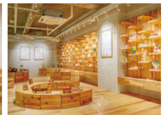
東京おもちゃ美術館に認定された100種類以上の「グッド・トイ」も自由に遊べる

シニア作家や文化人の本が相次いで出版され、書店の棚では不動の地位を占めています。岩手在住のシニア作家からも、負けていません。健筆を振るっています。