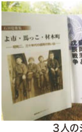
3人のシニアの新作

シニア作家や文化人の本が相次いで出版され、書店の棚では不動の地位を占めています。岩手在住のシニア作家からも、負けていません。健筆を振るっています。