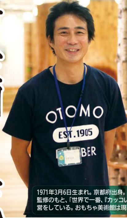
1971年3月6日生まれ。京都府出身。花巻おもちゃ美術館 館長。東京おもちゃ美術館総合監修のもと、「世界で一番、『カッコいい』木材店を目指す」株式会社小友木材店が設立・運営をしている。おもちゃ美術館は現在、東京、沖縄、山口、秋田にあり岩手で5館目となる