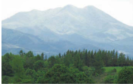
七時雨山の双耳峰はカッコいい。北峰と南峰をまわって編んだ毛糸の帽子を、私はいつも愛用している

でに転がり走るの「車之走峠」と命名されたユニークな峠だ。八幡平市西根の北側に位置する七時雨山麓は、秋田と盛岡を結ぶ鹿角街道であり、「流霞道」とも呼ばれた。盛岡城下より出立した旅人が街道を北進する場合、まず七時雨山を過ぎ、双耳峰と周辺の山並みとが重なりあうので、山塊は巨大なアコ