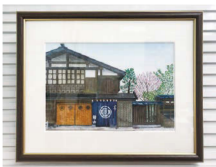
額縁の中にマットを入れるとより作品が素敵になります。選ぶマットの色によって印象がだいぶ変わります

第73回岩手芸術祭が10月3日から始まりました。3日と4日には肴町アーケード他で芸術体験イベントも開催され、大いに賑わいました。新型コロナウイルス感染症の影響で中止になっている 岩手芸術祭以外にも今秋は徐々に作品展が行われているようです。画材や額縁も例年のように売れています。当店で、作品を展示するための額縁、額縁の中、作品をより輝かせるためのマット(台紙)の取り扱いをしております。 岩手芸術祭の他にも今秋は徐々に作品展が行われているようです。画材や額縁も例年のように売れています。当店で、作品を展示するための額縁、額縁の中、作品をより輝かせるためのマット(台紙)の取り扱いをしております。