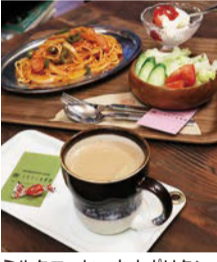
ミルクコーヒーとナポリタン。土曜ランチは気まぐれメニュー