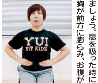
正しい呼吸を毎日の習慣に

「はくすう」呼吸を身につけて健康に過さず。 【正しい呼吸】 1日に約2万回行われている呼吸。みなさんは、呼吸を正しく行えていますか。 【ポイント】 ①椅子に浅く腰かけ、坐骨に体重を均等にかけます。 ②脚を中央に閉じます。 ③ウエスト部分に手を当て、呼吸によって動くことを感じましょう。鼻筋、みぞおち、へそ、脚の間が一直線上にあることを確認し、中心を動かさず、呼吸を助けます。ぜひ毎日の習慣にしましょう。 【実感ポイント】 ウエストが一回り小さくなる感覚で、おへそが背骨に近づき、正しい呼吸は、姿勢の維持に役立ちますし、内臓の動きを助けます。ぜひ毎日の習慣にしましょう。