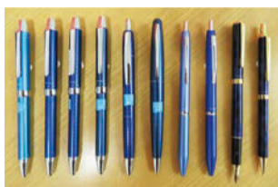
カラーバリエーションが広いブルー軸のペン。全てパイロットコーポレーションのもので、価格は¥1,100(税込)〜

「自分は体を動かすのが好きなので、デイサービスで働きたいと決めていました。当時のふきのとうは一軒家を改装した、デイサービスだったので、笑います。心がけているのは、一人ひとりへの声かけ、笑顔、言葉使い、そしてご家族の社長と出会います。」 「自分は体を動かすのが好きなので、デイサービスで働きたいと決めていました。当時のふきのとうは一軒家を改装した、デイサービスだったので、笑います。心がけているのは、一人ひとりへの声かけ、笑顔、言葉使い、そしてご家族の社長と出会います。」 「自分は体を動かすのが好きなので、デイサービスで働きたいと決めていました。当時のふきのとうは一軒家を改装した、デイサービスだったので、笑います。心がけているのは、一人ひとりへの声かけ、笑顔、言葉使い、そしてご家族の社長と出会います。」