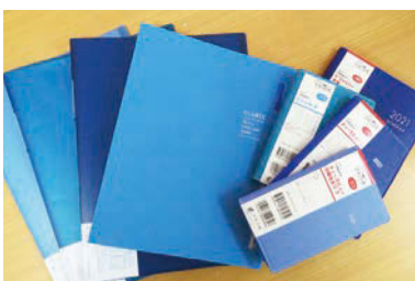
ブルーカラーのファイルと2021年手帳

パステル館店長の文具発見 今月は、青色について話をしたいと思います。今一 番青色で思い浮かぶのは、 医療従事者への感謝の色 ということ。全国の橋や鉄 塔などがブルーライトに 照らされた様子がニュー