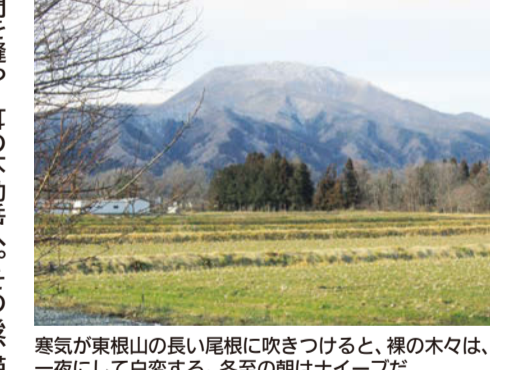
寒気が東根山の長い尾根に吹きつけると、裸の木々は、一夜にして白変する。冬至の朝はナイーブだ