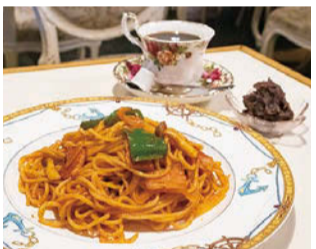
昔ながらのナポリタンとあんコーヒー

「最初は体を動かすのが好きなので、デイサービスで働きたいと決めていました。当時のふきのとうは一軒家を改装した、デイサービスだったので、笑います。心がけているのは、一人ひとりへの声かけ、笑顔、言葉使い、そしてご家族の社長と出会います。」 「最初は体を動かすのが好きなので、デイサービスで働きたいと決めていました。当時のふきのとうは一軒家を改装した、デイサービスだったので、笑います。心がけているのは、一人ひとりへの声かけ、笑顔、言葉使い、そしてご家族の社長と出会います。」 「最初は体を動かすのが好きなので、デイサービスで働きたいと決めていました。当時のふきのとうは一軒家を改装した、デイサービスだったので、笑います。心がけているのは、一人ひとりへの声かけ、笑顔、言葉使い、そしてご家族の社長と出会います。」