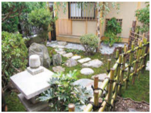
お手入れ次第で、素敵な庭を長く保つことができる

石割桜を80年以上にわたって管理している造園会社「豊香園」が、自宅の庭の楽しみ方をお届けします。 季節は春を迎え、庭のお手入れをしたり、新たに植物を植えるのに最適な気候となりました。今手をかけることで、育て方や管理が楽になるので、ぜひ挑戦してみてください。 暖かくなり植物の開花も多くみられますが、花は咲く時にパワーをたくさん使います。肥料をあげて栄養を補うことが大切です。弱っている植物には液体肥料を使うのが効果的です。栄養の効果を持続させるには固形肥料が適しています。