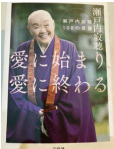
愛に始まり、愛に終わる 瀬戸内寂聴108の言葉 著:瀬戸内 寂聴/宝島社 1540円(税込)

数え年100歳の寂聴さん、生涯現役の僧侶で作家。51歳で中尊寺で得度、65歳で浄法寺町の天台寺の住職、70歳で三戸市名誉市民になるなど、岩手とゆかりが深く、県内にも多数のファンがいま。この新刊は、寂聴さんのこれまで法話や対談、インタビューなど、忌憚なく語った108の言葉を、愛、老い、祈りなど8章に散りばめた名言集です。「生きることは、愛すること。愛することは、許すこと。100歳近くまで生きてきて、到達しました」と率直に人生の意義を語る一珠玉と言えましょう。