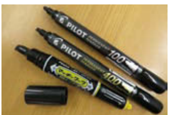
左:ZEBRA マッキーワーク ¥198(税込) 中:PILOT パーマネントマーカー400(中字平芯) ¥110(税込) 右:PILOT パーマネントマーカー100(中字丸芯) ¥110(税込)

部長役でした。何か困ったことが起こると、岡山弁とかいう「おえりやあせんのう……」と言って嘆いてみせると武術にどんなでもない力技を發揮する、まさに「能ある鷹は爪を隠す」の典型をの言葉でいうところの大ブレイクを遂げるのがテレビ