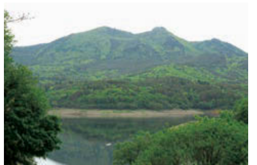
家族レジャーで盛んな田瀬湖には、かつて「金」を採った砂金鉱区や黄金山金山の歴史が眠っている。耳はジャンボだ

宮を祀った。その宮を守るという意味で、宮守村(旧)は「宮守」「宮守」「宮護」「宮守」「宮森」「宮杜」などと書く。 田瀬湖が初夏の陽に輝くころ、砥森大権現は山の神から「田の神」となつて里に降り