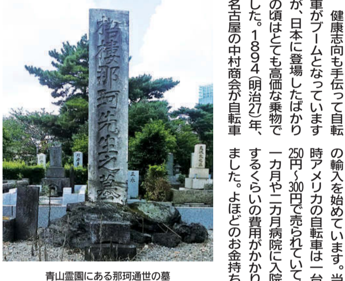
青山霊園にある那珂通世の墓

健康志向も手伝って自転車の輸入を始めています。当車がブームとなっていて、日本に登場したばかりの頃はとても高価な乗物でした。1894(明治27)年、名古屋の中村商会が自転車