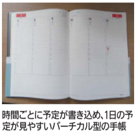
時間ごとに予定が書き込み、1日の予定が見やすいバーチャル型の手帳

猛暑が続いた今年の夏ですが、暦の上ではすでに秋です。季節を象徴する商品の一つにカレンダーや手帳がありますが、お店によっては2022年の商品がすでに店頭で並んでいることも。手帳を使う人が何を大事にしているのか表れるアイテムだと思っています。1年間使い続けるので、表紙のカラーやデザイン、サイズもこだわられるポイントだと思いますが、手帳の人気のフォーマットは大きく分けて3点あります。 一つ目は月間ブロック型。カレンダーのように二カ月を見通して使えるタイプです。このタイプは薄手の商品が多く、コンパクトなものを選べば軽く持ち運びが可能です。曜日の始まりは、カレンダーと同じ見方ができる日曜始まりのほか、月 二つ目は、週間シート型。シニア世代でも使っている方が多いと思いますが、左側に一週間のページがあり、右側がメモ欄になっているタイプの手帳です。記入箇所がたくさんあるのでいろいろと書き込めるのが良い点です。 三つ目は、バーチャル型。こちらは、時間と予定の管理どちらにも必要な方に向いています。時間軸に従って予定を記入していきますので、一目で一日の流れが分かりますし予定の重複を防ぐことも可能です。 来年の手帳を買う際、今年のものと同じ手帳を買った方が多いと思いますが、左側か、今使っているものを持参されると良いでしょう。お店で商品が探しやすいです。