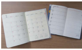
左が月間ブロック型、右が週間シート型の手帳。仕事用とプライベート用で使い分けもおススメ

猛暑が続いた今年の夏ですが、暦の上ではすでに秋です。季節を象徴する商品の一つにカレンダーや手帳がありますが、お店によっては2022年の商品がすでに店頭で並んでいることも。手帳を使う人が何を大事にしているのか表れるアイテムだと思っています。1年間使い続けるので、表紙のカラーやデザイン、サイズもこだわられるポイントだと思いますが、手帳の人気のフォーマットは大きく分けて3点あります。 一つ目は月間ブロック型。カレンダーのように二カ月を見通して使えるタイプです。このタイプは薄手の商品が多く、コンパクトなものを選べば軽く持ち運びが可能です。曜日の始まりは、カレンダーと同じ見方ができる日曜始まりのほか、月 二つ目は、週間シート型。シニア世代でも使っている方が多いと思いますが、左側に一週間のページがあり、右側がメモ欄になっているタイプの手帳です。記入箇所がたくさんあるのでいろいろと書き込めるのが良い点です。 三つ目は、バーチャル型。こちらは、時間と予定の管理どちらにも必要な方に向いています。時間軸に従って予定を記入していきますので、一目で一日の流れが分かりますし予定の重複を防ぐことも可能です。 来年の手帳を買う際、今年のものと同じ手帳を買った方が多いと思いますが、左側か、今使っているものを持参されると良いでしょう。お店で商品が探しやすいです。