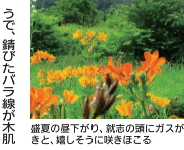
盛夏の屋下がり、就志の頭にガスが流れていく。草花はいきいきと、嬉しそうに咲きほこる

塩・海産物の交易がなされたという。岩手にはツクシが三つある。葛巻町のツクシ森や突紫森と同じく就志森もまた、尖った頭を野草の「つくしんぼ」に例えたりしている。 さて、登り