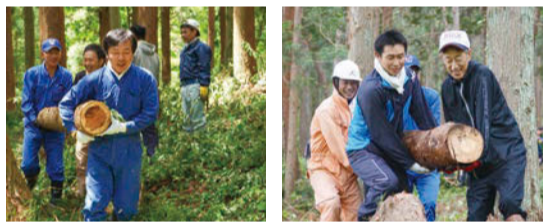
平成30年森林環境保全運動の様子。地元の支援事業の一環で職員とその家族が参加し、世代間の隔りなく協力し合い森林整備に励みます