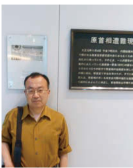
原敬暗殺を伝える銘板にて(東京駅)