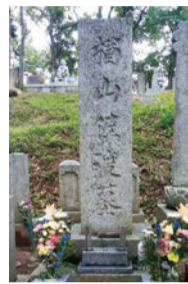
榎山佐渡の墓 (聖寿禅寺)

に逆らった藩」とされ、朝敵の汚名を着せられ、盛岡藩の責任を一身に背負って生涯を終えたのが盛岡藩で指導的立場にいた榎山佐渡だったのです。