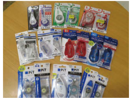
修正テープとテープのりの本体、詰め替え

2020年7月1日にスタートしたレジ袋の有料化。透明なフィルムの袋に入っていると、買った物の際、商品自体の中身も確認できずし品質の保護にも一役買っています。しかし、商品の開封し、改めてごみの分別をしてみると、まだプラスチックごみを削減する工夫が必要だと実感します。ごくわずかですが、一部の商品には紙製パッケージだけで包装されているものも出始めました。環境を考慮した上でのメーカーの取り組みと云えます。