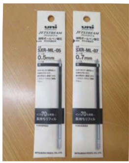
三菱鉛筆(uni)のジェットストリームの替え芯。従来と同じサイズですが、容器の内側を薄くしインク量が70%増量

今あるモノやサービスをデジタルでさらに便利にするのがDX(デジタルトランスフォーメーション)化。今回は飲み会や懇親会などイベント関連で期待されるDXを紹介しよう。コロナ禍で歓迎会や花見ができない状況が続き、お酒を飲んで親睦を深める機会が減りました。そこで定着しつつあるのがリモート飲み会。自宅からウェブ画面で参加でき、会場費や交通費がかからず海外からも簡単に参加できます。インターネット上でビデオ