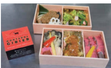
岩手・大槌鹿をおいしく楽しめる「MANA UP BOX」3,500円(税込)完全予約制で6,000円以上で配達無料

「地元産の物を食べながら地域に貢献できるだけでなく、食育や環境教育にもつながり、商品を食べながら食卓で会話が弾んでくれたら嬉しいですね」と柴田社長はこれからの食を通じた岩手のプロデュースに余念がありません。