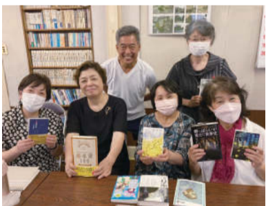
お気に入りシェアしてワクワク