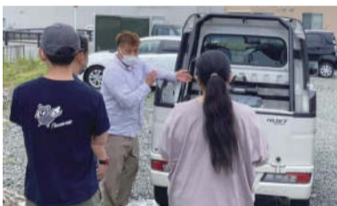
岩手・大槌鹿をおいしく楽しめる「MANA UP BOX」3,500円(税込)完全予約制で6,000円以上で配達無料