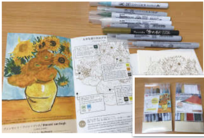
商品名:おうちで名画コレクション 塗り絵でゴッホA 価格:¥1595(税込) メーカー:呉竹 品番:HAC-1