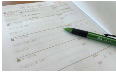
ID、パスワードの管理はしっかりと

一つ目は、固形タイプの水彩絵の具の顔料です。日本画独特の配色のものから最近では色鮮やかなものまで増えてきました。「栗皮茶」「朽葉」のように「色ごと」に付けられた日本の四季折々を感じる名前もおすすめです。