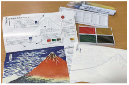
商品名:おうちで名画コレクション 塗り絵で北斎A 価格:¥1650(税込) メーカー:呉竹 品番:HAC-3

探すのもいいですね。また、重ね塗りや混色が可能な商品も多く、水筆で上からなぞると水彩画のように色の濃さを調整できるなど、表現の幅が広がります。穂先を使うので、穂先を使う