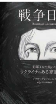
著:オリガ・グレンニク 河出書房新社刊/1,595円(税込)

「日常」。日々どこからか聞こえてくる爆撃音、自分たちが巻き込まれなかった安堵と、次は自分たちかもしないという恐怖。複雑な著者の思いが短い文章で綴られて日記から、身近に迫る「死」の恐ろしさを感じます。ウクライナについて度々報道されていますが、この本はどこか遠い出来事に見えるきつかけ