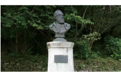
鳴滝塾跡地にあるシーボルトの胸像(長崎)

シーボルトとの出会いにより蘭学者として大成した長英ですが、幕府の政策を批判した『夢物語』を出版したことで投獄の憂き目にあいます。その後、大火に乗じて脱獄、各地を転々としてますが、1850(嘉永三年)江戸の隠れ家を幕府の役人