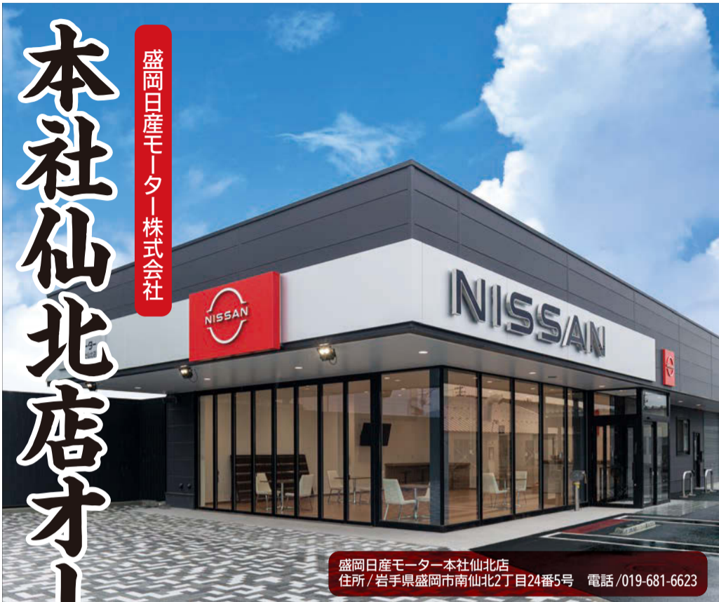
盛岡日産モーター本社仙北店 住所 / 岩手県盛岡市南仙北2丁目24番5号 電話 / 019-681-6623