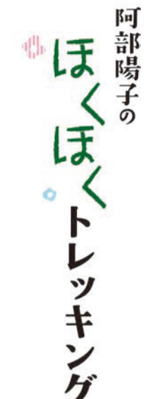
阿部陽子 (公社)日本山岳会岩手支部 支部長 / 阿部陽子 IBCラジオ放送 「いわての山トレッキングガイド」 (毎週土曜日6:45~7:00)に出演中

一般的に登山口は登り30分かかるつづろコース、夏油温泉から経塚山経由で縦走した場合は、金明水の避難小屋に1泊したい。秋田県東成瀬コースは登り4時間・下り3時間。どの路を歩いても登山者は花々に歓迎されるだろう。室町時代の能楽師・世阿