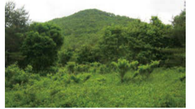
穴目ヶ岳の古い草原に着くと、突如としてピラミダルの山頂部が出現。牛歩で30分、上の眺めはどんなかな

は標高1168m、今や「進化をとげる北天の雄」なのだ。夏の盛りは、緑の空や、見当すらつかない。登山口から林道に踏みこむと、群生したニリンソウ