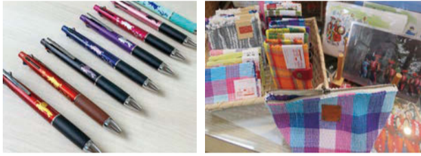
平金商店オリジナルボールペン 盛岡さんざ踊り。太鼓と踊りのシルエットがプリントされている、各1,650円(税込)

程はとも手間がかかりますが、新しく生まれ変わった布地や商品を見ると、素晴らしいものばかり。上がった布地はペタペタと複数枚貼って使えば、まるで紙面上でデザインが再現されているかのようです。 ボールペンなら、自分用にもプレゼント用にも気軽に使えて贈れるアイテムです。盛岡を伝えるさんざ踊りのロゴの入ったボールペンは全8色。さんざ踊りは赤のイメージが強いですが、このボールペンなら自分の好きな色で使えます。