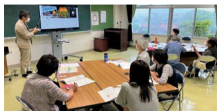
一時的に保存されるキャッシュがスマホ容量を圧迫しているかもしれません