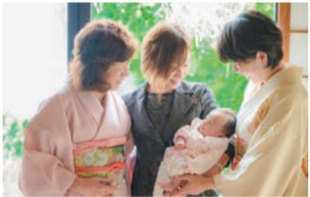
古き良きところは残し、時代の変化を取り入れてきた山田美容院

100年以上になる山田美容院。「真心込めてお支度を提供しきれなくなったお客さまの笑顔を見たい」という社長の信念のもと、多くのお客さんの人生の節目を彩ってきました。100年の間、変化する社会環境や次々に生まれる流行や新技術にいち早く順応し、日頃の間に、変化する社会環境や次々に生まれる流行や新技術にいち早く順応し、日頃