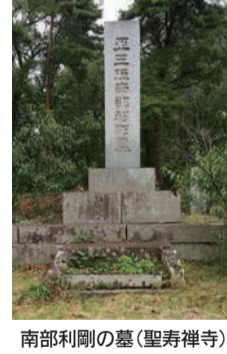
南部利剛の墓(聖寿禅寺)