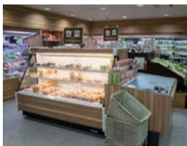
惣菜コーナーの野菜たっぷりメニューも大人気。旬を味わえる季節限定メニューも好評