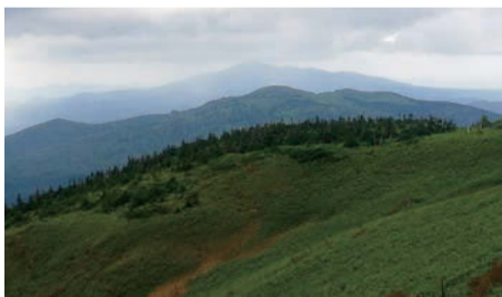
見返峠(アスピーテライン)で秋田側を眺める。暗緑色のオオシラビソ・奥に焼山の大地・三角形の森吉山が天を衝く

湯ノ沢は40℃前後の強酸性。にもかかわらずイトミミズの類だろが、10mmほどの赤い生命体がワサワサと浮遊していた。