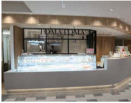
フルーツ主体のスイーツが評判のスイーツコーナー

街でよく見かける真っ赤なトマトが目印の戸塚商店の大きなワゴン車。新鮮な野菜や果物を載せ、今日も県内各地を駆け巡ります。 今年で設立50年を迎える戸塚商店は青果の卸しとカット野菜加工を中心に、仕入れた野菜や果物を販売するTOMATOMAとつつかフェザン店や野菜たっぷりカレーメニューが自慢のトマトキッチンなど幅広く展開しています。「青果市場を中心にいろいろな品目を仕入れているので珍しい野菜や果物、他のお店ではなかなか見かけない産地の