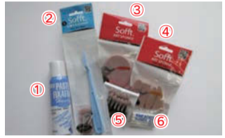
①定着剤(フィキサチフ) ¥1,100、②ナイフ&カッター ¥605、③アートスポンジ ¥605、④アートスポンジ ¥770、⑤アプリケーター ¥1,210、⑥消しゴム ¥770 ※価格は全て税込 ※全てホルベイン画材

いろいろな思い出がよみがえり、あったかい気持ちになりました。そして、ふと思いつき絵手紙を描いて送ることにしました。 一筆一筆に思いが込められる絵手紙を今回はパンパステルという画材で描くことに。ファンデーションのようにキメ細かい粒子で、消しゴムで消せて紙の上で混色が可能。いろいろな形状のアートスポンジで広く塗り、細かい部分はアプリケーターというアイシャドウチップのような道具で塗り込みます。仕上げに定着剤(フィ