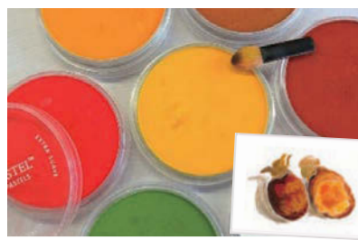
パンパステル(ホルベイン画材) 各¥1,045(税込)

店頭に並んでいる干し柿を見て母を思い出しました。「元気になっているかな」と柿は苦手だけど干し柿は甘くて好きだったな…私も干し柿作りに挑戦したな…と