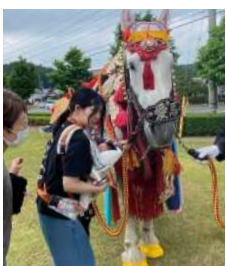
ふれあいまつりでは装束をつけた馬との触れ合いコーナーを設置予定

初夏の岩手を彩る風物詩として知られる「チャグチャグ馬コ」。毎年6月、色鮮やかな装束を纏った馬たちが、滝沢市の鬼越前神社から盛岡市の盛岡八幡宮まで、およそ14kmの道のりをゆっくりと行進します。馬の胸元や鞍につけられた鈴が「チャグチャグ」と鳴ることから、この愛らしい名前が付けられました。