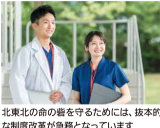
北東北の命の誓を守るためには、抜本的な制度改革が急務となっています

岩手にお住いの皆さまは、現在の北東北における県の境界線が藩制度と異なっていることはよくご存知だと思います。北東北における県の境界線は、時の政府が藩制度と