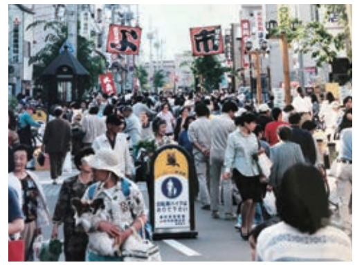
シニアにも愛されるよ市