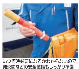
いつ何時必要になるかわからないので、発炎筒などの安全装備もしっかり準備