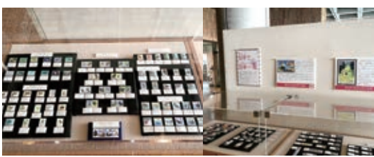
県立博物館所蔵の切手コレクション473種をグランドホールに展示中。見とれたえがきがあり、老いも若きもつい時間を忘れて見入ってしまうほど

勢ぞろいする「アニメの切手」。今回の展覧会は、一つの切手から新たな発見があること間違いなしです。手のひら美術館へぜひ足を運んでみませんか」と話してくださいました。