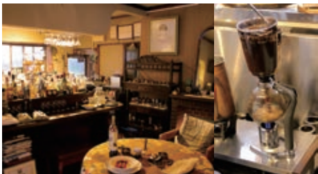
じっくり淹れるサイフォン珈琲と自然の音色を味わえる空間