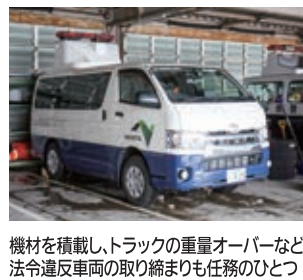
機材を積載し、トラックの重量オーバーなど法令違反車両の取り締まりも任務のひとつ

「おそろしくそのまま北海道に腰を据えると思ったんですよ。父は私の就職先まで準備していました。当時を思い返します。しかし予定していた就職が難しくなり、新たな職探しをしていたある日、新聞の「ハイウェイパトロール隊員」を募集する求人広告が目にとまりました。「ハイウェイパトロール」とい