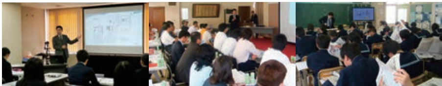
左(盛岡信用金庫の内定者研修)中央(企業セミナー)右(中学校の授業)の風景。記事を読むコツを図式で解説し、フェイクニュースの話題など最新情報も組み込んで、気軽に学べるテキストに。セミナーの後は「もっと新聞を読みます」という声が多い

宮城県気仙沼市出身。製薬会社勤務を経て、平成9年に岩手に移住。『(株)若手日報都南センター』代表取締役社長に就任。学生時代は器械体操、柔道などスポーツに親しみ、水泳は今も継続。趣味はネット麻雀と読書、多彩な顔を持っています