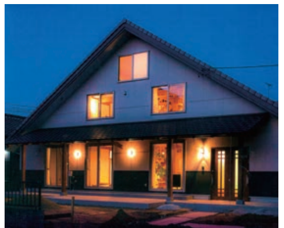
「サイエンスホーム」は、日本の伝統的手法を進化させた、木のぬくもりたっぷりの家。居住空間を3層に分けることで、様々なスタイルの暮らし方ができる、新しい発想の家です。また、「真壁づくり」と「外張り断熱」の独自工法の組み合わせで一年中快適で省エネな暮らしを実現。心からくつろげる、新しい日本の家の誕生です。

また、弊社は女性も働きがいがある職場として、子ども手当の充実も図っています。社員全員とその家族を集めたパーティなど、みんなが心を一つにする機会も作っています。人は宝いい人材を確保することは、会社にとって何より大切なことです。