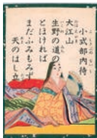
小式部内侍の歌合の場面

よ！失礼な！といった、実に機知に富んだ才気煥発な反撃は、先輩にしてベテランのパワハラのようなシチュエーション場面・状況が分からないと、その痛快・見事さがピンとこないであろう。そんな場ではまだ若い女性とはかく何につけ、見くびられたり、からかわれたりしていたらどうからかえって中納言もさぞ大恥かいたにちがいない。 ただ、「歌合」というその場面は、平安時代の上流階級が集い、左右に分かれ各一首ずつを組み合わせ、その優秀を判者(審判)が勝負を判定する文学的な競技のような遊戯である。