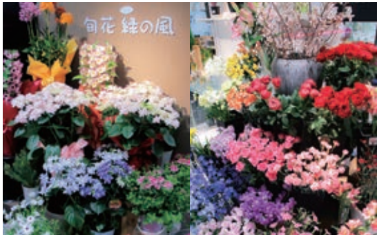
いつ訪れても飽きのこない楽しみが広がる切り花コーナー。ギフトにもぴったりの鉢花のほか、フリーズドライフラワーも充実

季節感や鮮度にこだわ り、専属バイヤーが国内外 から厳選した色とりどりの 旬の花を豊富に仕入れ、圧 倒的な品揃えで花のあるラ イフスタイルを提案してい るのがNanaki階にあ る「旬花 緑の風」です。 好きな種類を好きなだ け選べる切り花コーナー には、お手頃価 格の花を豊富 に用意。バイキ ングのように 好きな切り花 を選んで、自由 な組み合わせ で買えるのも 嬉しいところ です。今の時期 は、季節感あふ れるカーネー ション、トルコ ギキョウ、芍薬