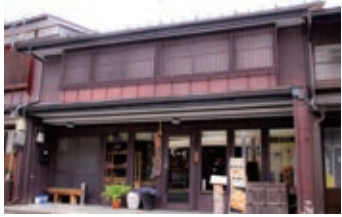
懐かしい空間はシニアのたまり場としてもおすすめ

「いたく錆びしヒストル出でぬ砂山の砂を指もて掘りてありしに」があり、作詩には啄木の四千の短歌が参考になります。