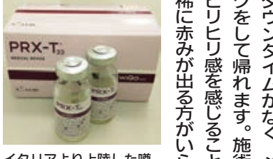
イタリアより上陸した噂のコラーゲンピール

「乾燥肌が良くなった」などの喜びの声をいただいております。メディアで数多く取り上げられ、セブがこぞ受けている「コラーゲンピール」をぜひお試しください。