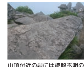
山頂付近の岩には読解不明の文字らしきものが刻まれている。

ラフ(古代文字探索を行った。奇岩の数々は日本ピラミッドの定義として語られる方位を示す石であったり、かつては太陽光を反射していた鏡石ではなかったという伝説のもと、実際にそれらに触れ、感じるものを通して古代文字らしきものとの遭遇、そして山頂から見た古代文字探しは夥しい岩