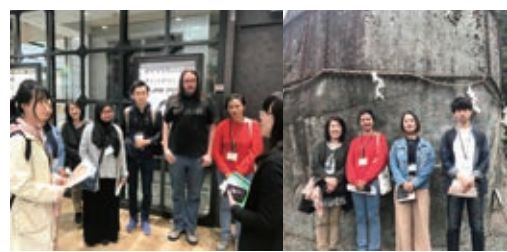
(左)フェザンで説明を受ける留学生ら(右)三ツ石神社で

「鮎釣りは腕の良さがそのまま反映される、まるでオーケストラのコンダクターのようなものだね。他の釣りにはない面白さがあるから、もう他の釣りはほしくないよ」と鮎釣りの醍醐味を楽しそうに話してくれました。