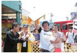
ノリで参加した私は世界チャンピオンになってしまいました

撮影は、東京・六本木のテレビ朝日の特設スタジオで早朝から夕方遅くまでかかったのですが、なかなかできない経験だったので、リハーサルから本番まで全てが新鮮でした。 撮影は圧倒的に待ち時間の方が長かったので共演し