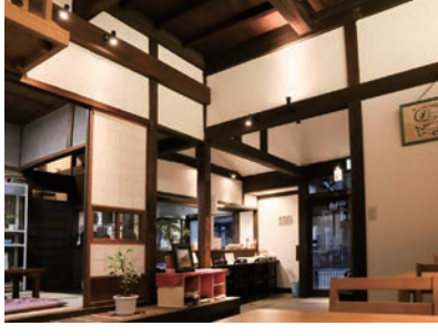
店舗や小上がりは以前の間取りをそのままに、昼呑みも楽しめる心地よい場所に！

※会場へお越しの際は、公共交通機関をご利用ください。 ＜地域ケア係＞ ■元気はなまる筋力アップ教室 内容：簡単筋力アップ体操と健康講座、シルバリーリハビリ体操の体験 参加費：無料 対象：概ね65歳以上の盛岡市民(申し込み不要) 持ち物：上履き・タオル・飲み物 問合せ：613-8144(長寿社会課地域ケア係)