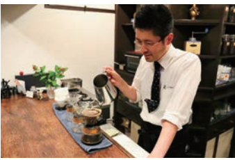
昭和の喫茶店を感じさせる店を提供するのは、最新・最善の「味」を目指す