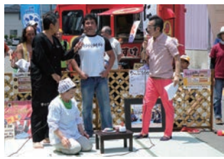
今や矢野町の名物行事になった「ちやぶ台返し世界大会」

「ハカヤロー！」ガシャーン！巨人の星でおなじみ『ちやぶ台返し』の世界大会が毎年6月くらいに矢野町で開催されているのですが、私は軽い気持ちで参加して、すっかり優勝してしまった事があるのです。 副賞の金のちやぶ台を抱え、えたま沢山のカメラに取り囲まれ、地方テレビはもちろん全国ネットの番組でもかなりの勢いで取り上げられました。 そして、気がつくとい私『ちやぶ台返し世界チャンピオン』として地元テレビ番組に何度も出演することになり、ついには全国ネットのテレビ番組でジャニーズJrと対戦する事になりました。 地元商店街の小さな催し物だと気軽に考えていたら、どどんと話が大きくなっていききました。 撮影は、東京・六本木のテレビ朝日の特設スタジオで早朝から夕方遅くまでかかったのですが、なかなかできない経験だったので、リハーサルから本番まで全てが新鮮でした。 撮影は圧倒的に待ち時間の方が長かったので共演し