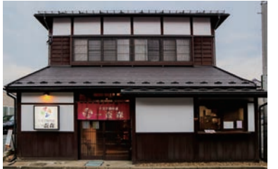
落ち着きある風格の昔の建物を活かしながら、基礎・断熱・耐震は改修により万全