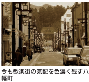
今も歓楽街の気配を色濃く残す八幡町