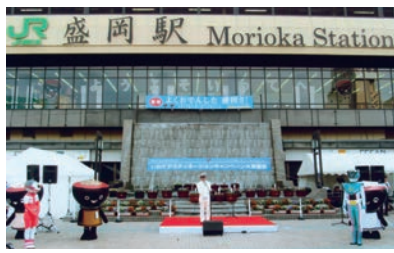
2012年6月30日盛岡駅最後の日のスピーチ

「お客さまからのありがとうの言葉に涙が止まりませんでした」。そして現在は、盛岡ターミナルビル株式会社代表取締役社長として、「地域を元気に幸せに」とホテル事業、駅ビル事業を運営。「実は会社のシンボルマークが四つ葉のクローバーなのですが、着任後、会社の原点を見つめ直し、先人が築いてきたものをこの先どう繋げて行くかと考えていた時にシンボルマークの意味に目が向きました。四つ葉の四枚の葉は盛岡の山(手山、姫神山、早池峰山、南昌山)を、葉の間は、盛岡の川(北上川、中津川、栗石川)を表し、JR線(東北本線、田沢湖線、山田線)を意味している。当社が大切にしているのは、お客さまをはじめとした『人と人との交わり』。私たちは常に『地域を元気にしあわせに』を心がけて仕事に専心しています。自らも近づきつつあるシニア世代に向けて、「気持ちよく働くこと』『笑うこと』を忘れず、1日を楽しく過ごすことが大事」と話します。