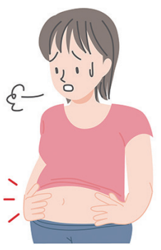
なかなか痩せない体とさようなら

ご相談に来られる方で多いお悩みは、ダイエットをしても気にならな部分がない。特に腹部や太ももなど下半身や腕の腕が、というお話をよく聞きます。 脂肪を溶解する薬液を、数回注入する方法です。ごく細い針で薬液を注入するので、痛みはほとんどありません。 脂肪吸引 脂肪を一度でしっかりと吸引する方法。丁寧に根こそぎ脂肪を取り除ききれいな 脂肪を溶解する薬液を、数回注入する方法です。ごく細い針で薬液を注入するので、痛みはほとんどありません。 脂肪吸引 脂肪を一度でしっかりと吸引する方法。丁寧に根こそぎ脂肪を取り除ききれいな