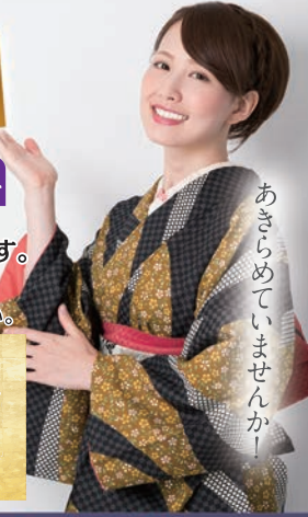
あきらめていませんか?

開催場所/こうや呉服店 1月21日・22日 午前10:00~午後7:00 ※22日は午後5:00まで