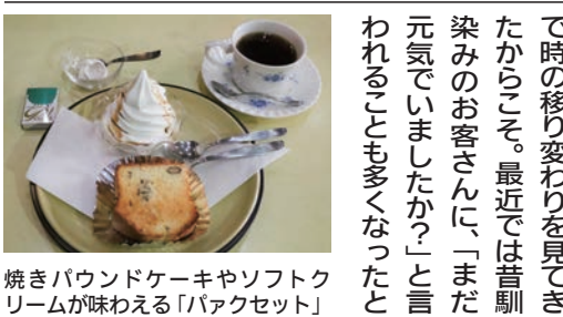
焼きパウンドケーキやソフトクリームが味わえる「バクセット」