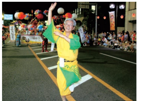
佐藤さん自身も、さんざん踊りに深い思い入れが。「今でも『踊る駅長』と呼んでくださる方がいて、嬉しいです」