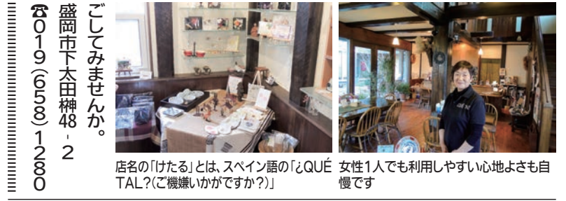
店名の「けたる」とは、スペイン語の「¿QUE TAL?」(ご機嫌いかがですか?) 女性1人でも利用しやすい心地よさも自慢です

72歳になる人が多く、206万人もおり、逆に一番新しい亥年である2007年(平成19年)生まれの12歳は、全体で108万人で、1935年(昭和10年)生まれの84歳の106万人ときほど大差がないという結果にも、現代の少子化傾向を物語り、それをわさって、それから逸脱した時に病の裾野が少しずつ広がるのかも知れません。